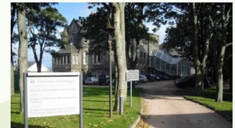
School of Economics & Finance, University of St Andrews

mich heran. Die Abteilung, für die ich auch bisher gearbeitet hatte, erwirtschaftet etwa 25% ihres Umsatzes im Ausland, sodass unser deutsches Team im Rahmen unterschiedlichster Projekte von Irland bis nach Nigeria und China im Einsatz ist.