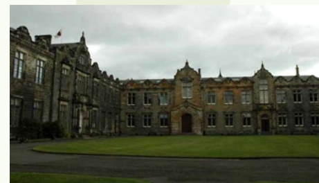
St Salvator's Quad, University of St Andrews

Definitiv! Meine Vertiefung in Economics hat mir für das Masterstudium sehr weitergeholfen, und insbesondere die Tatsache, dass der Fachbereich mit seinen Professoren und somit auch der Lehre international ausgerichtet ist, war ein wichtiger Faktor für mein weiteres Studium. Während meiner Masterarbeit, aber auch schon während des Studiums in St Andrews, hatte ich tatsächlich mehrfach Forschungsarbeiten von ehemaligen Professoren aus Frankfurt vor mir.