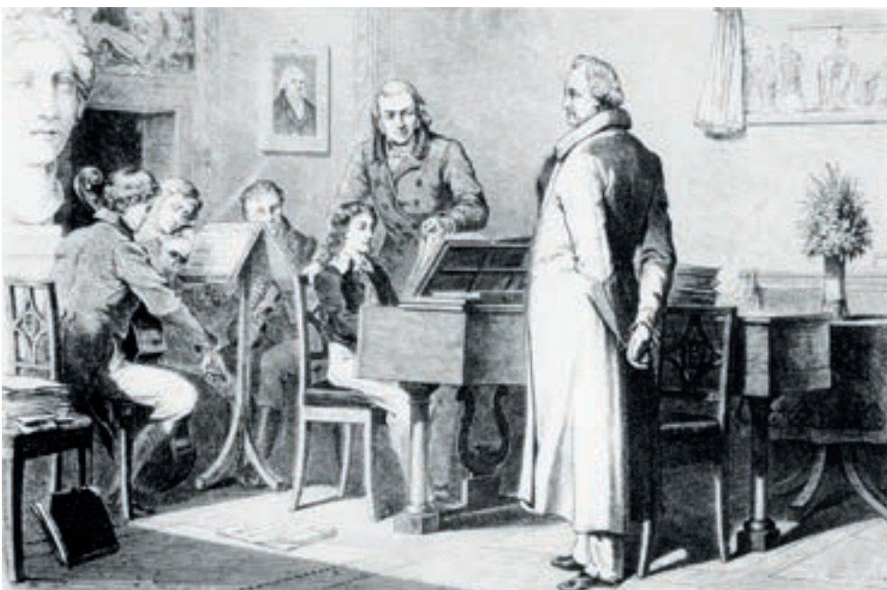
Musikabende im Juno-Zimmer: Goethe lud häufig zu kulturellen Veranstaltungen in sein Haus ein, was seine Haushaltskasse nicht unwesentlich belastete. Hier spielt der 13-jährige Felix Mendelssohn Bartholdy, der als Schüler von Friedrich Zelters 1821 bei Goethe vorgestellt wurde. Goethe war fasziniert von der kompositorischen Begabung des Jungen.

Auch nach dem Tod des Sohnes August im Jahr 1830, der akribisch die Bücher geföhrt hatte, kam die Hauswirtschaft noch einmal in Schiefelage, da die Schwiegertochter recht verschwenderisch mit dem Geld umging. Eine Freundin berichtet, dass Goethe deshalb mit dem Schlüssel zum Schrank, in dem das teure Feuerholz aufbewahrt wurde, unter dem Kopfkissen schlief. Auch wenn er die finanzielle Situation prinzipiell im Griff hatte und die Grundlage des Haushalts solide blieb, musste sich Goethe mehrfach in solchen Situationen Geld von Freunden und sogar von ehemaligen Dienern leihen. Doch war er seinerseits ebenfalls freigiebig, wenn es darum ging, Bekannte