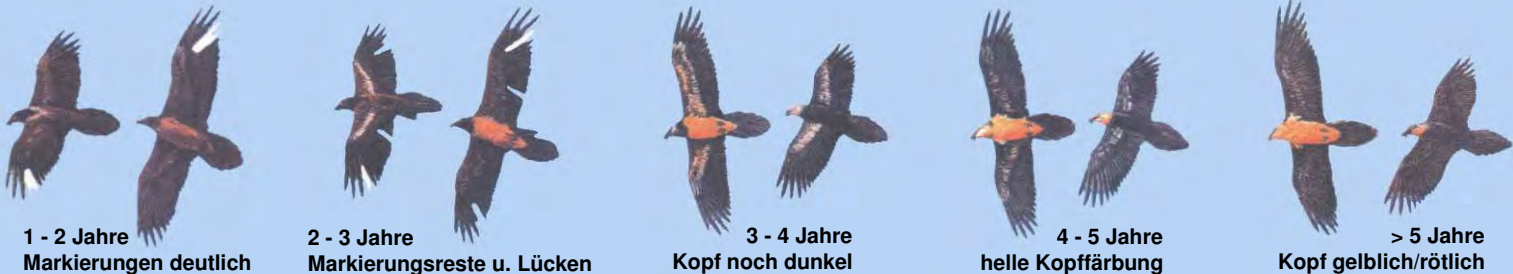
1 - 2 Jahre Markierungen deutlich

Grafiken: El Quebrantahuesos en los Pireneos (R. Heredia y B. Heredia); Ministerio de Agricultura Pesca y Alimentación. Publicaciones del Instituto Nacional para la Conservación de la Naturaleza, 1991