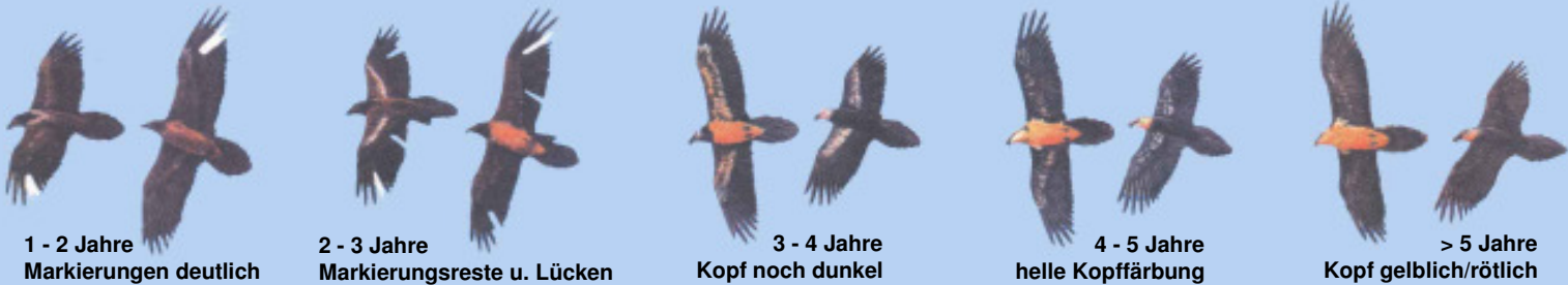
1 - 2 Jahre Markierungen deutlich

Grafiken: El Quebrantahuesos en los Pireneos (R. Heredia y B. Heredia); Ministerio de Agricultura Pesca y Alimentación. Publicaciones del Instituto Nacional para la Conservación de la Naturaleza, 1991