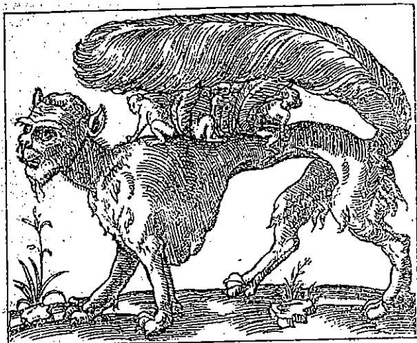
Abb. 3 – André Thevet, Les singularités de la France antartique, Paris 1557/1558.