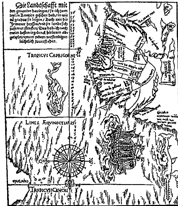
Abb. 2 – Hans Staden, Wahrhaftige Historia, Marburg 1557.