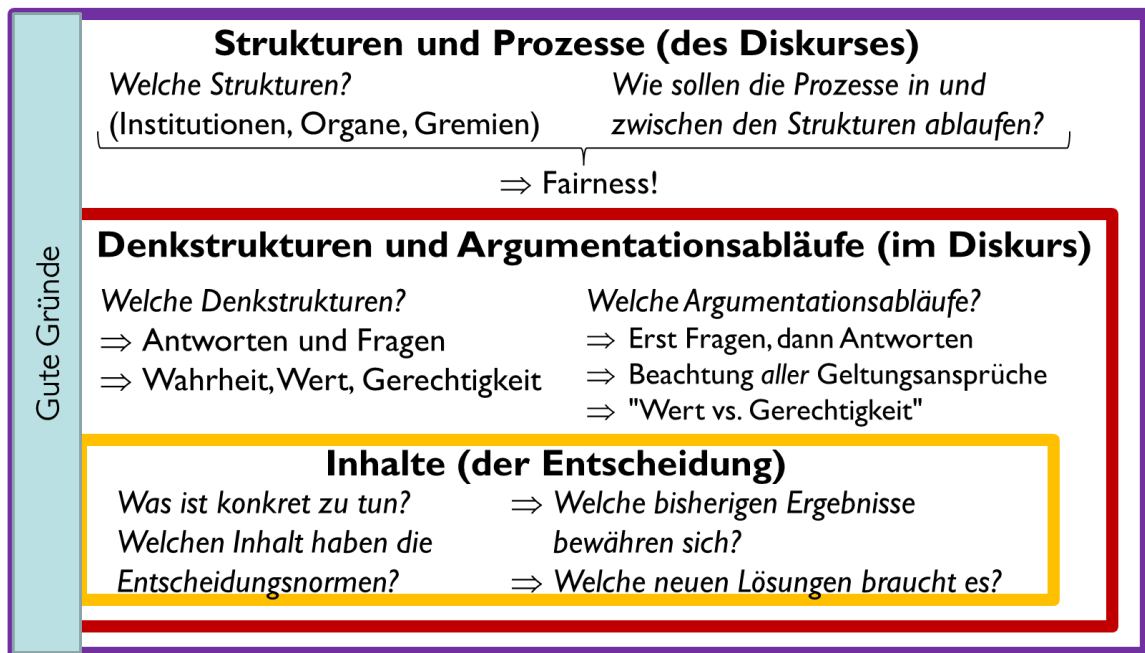
Abbildung 3: Verfassung des interrationalen Diskurses:

Die genannten Vorgaben für den interrationalen Diskurs gelten in angepasster Form auch für rationale Diskurse.