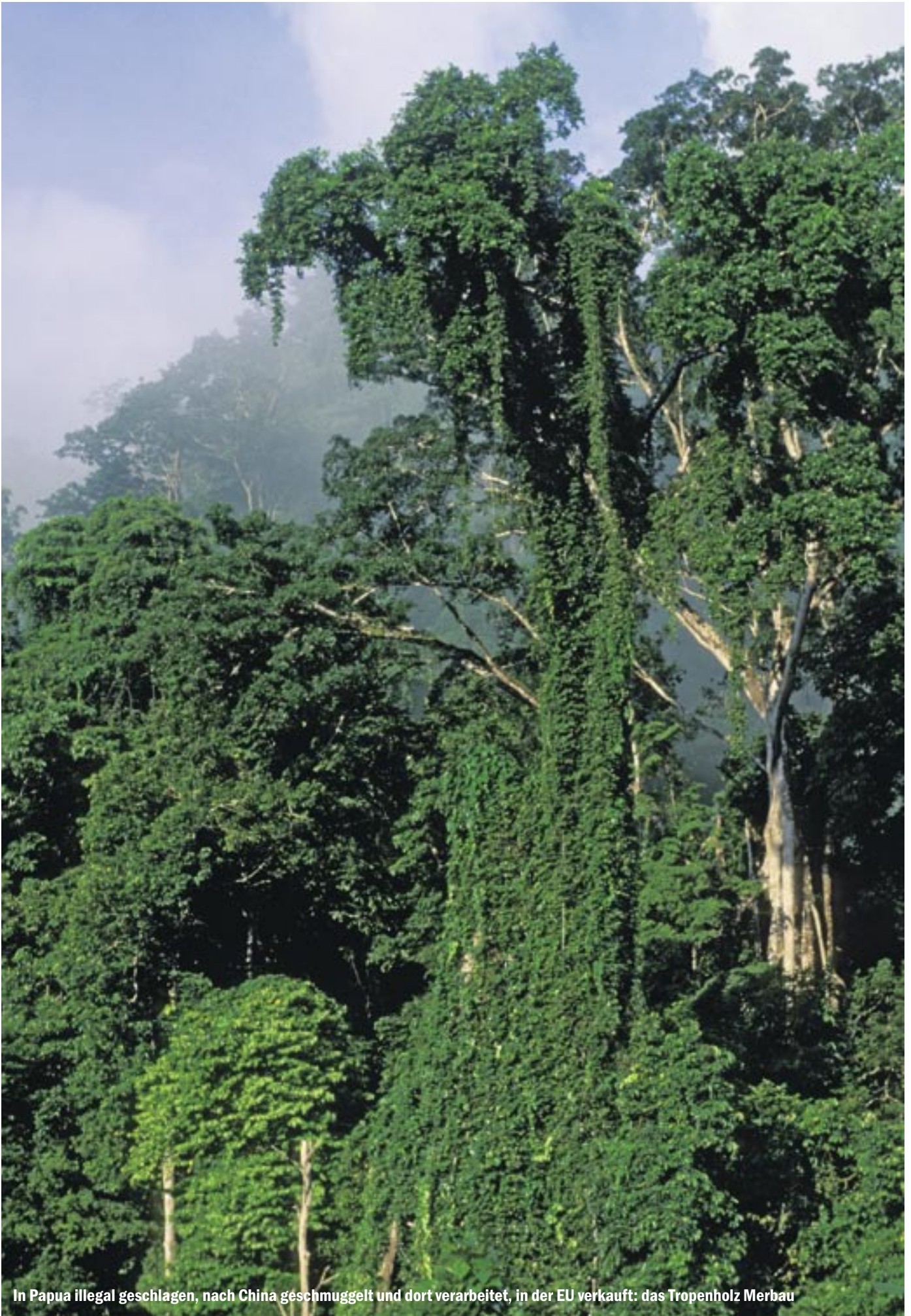
In Papua illegal geschlagen, nach China geschmuggelt und dort verarbeitet, in der EU verkauft: das Tropenholz Merbau