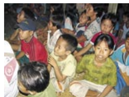
Kinder ohne Zukunft, falls die Ausbreitung der Plantagen nicht gestoppt wird