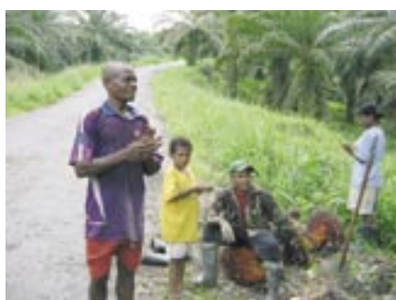
Kleinbauern werden zu Tagelöhnern auf Plantagen degradiert