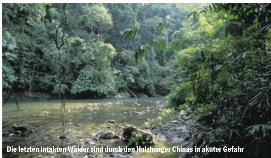
Die letzten intakten Wälder sind durch den Holz hunger Chinas in akuter Gefahr

Indonesien verhandelt inzwischen mit anderen asiatischen Staaten mit dem Ziel, dass Merbau (die Baumarten Intsia bijuga und Intsia palembanica ) in den CITES-Anhang III aufgenommen werden. Eingeschränkt wäre dann der Handel mit ganzen Stämmen, Schnittholz und Furnieren. Mit der Maßnahme soll eine Übernutzung der Merbau-Bestände vor allem im indonesischen West-Papua verhindert werden, so die offizielle Begründung.