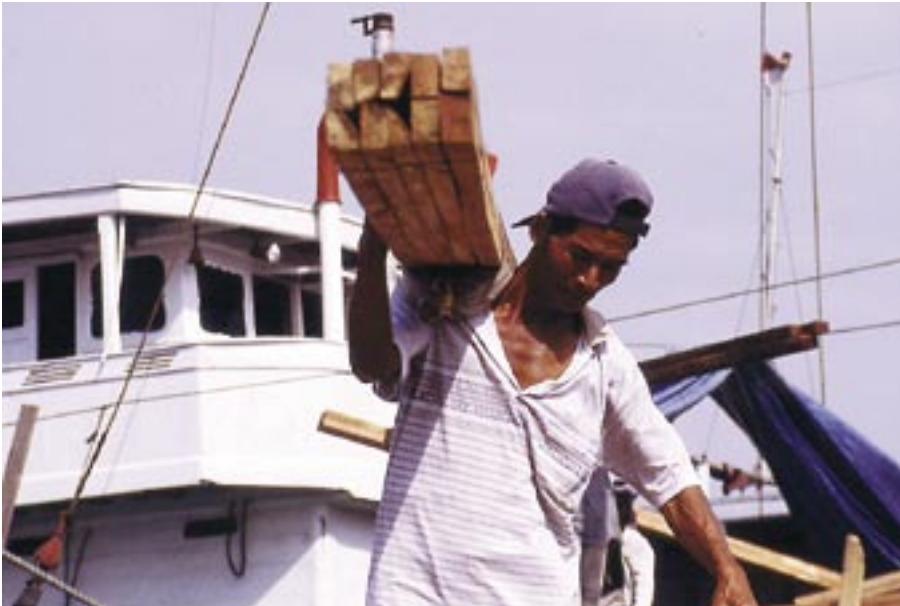
Aus dem Wald, über die Schulter, landet das Raubholz unter unseren Füßen