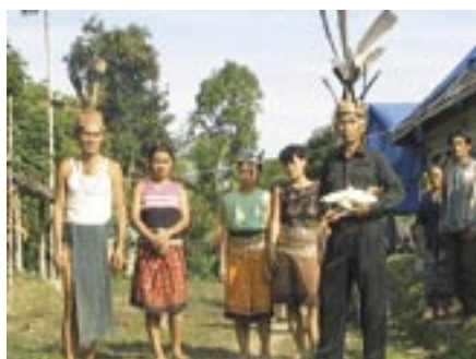
Traditionelle Dorfstrukturen werden aufgebrochen und zerstört