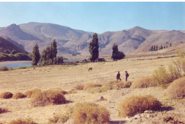
1. Pampa del Malleo, Neuquén.

vive con un concepto de libertad que le es propio y se expresa según su historia, sus modos de vida, sus costumbres, sus mitos.