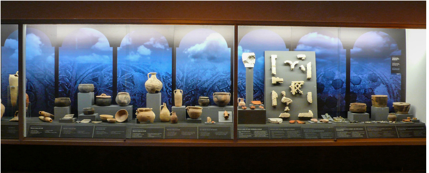
Fig. 10. Materiales tardorromanos y visigodos. Museo monográfico, sala Spania .

en conocimiento es necesaria. Se destacó finalmente el esfuerzo realizado por la Fundación en el ámbito de la tutela, la docencia con cursos, prácticas regladas y jornadas divulgativas como «Los lunes con la Alcudía», y la divulgación a través de publicaciones, seminarios y exposiciones.