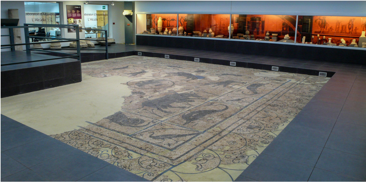
Fig. 6. Sala Hispania del Museo Monográfico.

de la Universidad de Alicante) como un espacio expositivo que permite dar a conocer La Alcudia a la comunidad universitaria y utilizarla como espacio docente. Concluyó que hoy la Fundación La Alcudia no sólo es un centro de interpretación, un museo o las ruinas de las antiguas ciudades que la ocuparon, sino que también pretende ser, desde el trabajo cotidiano de sus áreas de restauración, turismo, documentación y arqueología, un enclave donde la investigación, la conservación, la difusión y la docencia se combinen para preservar y dinamizar un rico patrimonio ubicado en un enclave cultural y medioambiental de excepción.