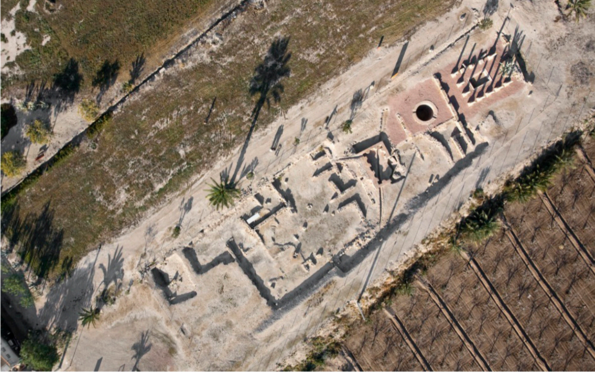
Fig. 1. Domus del sector 3F de La Alcudia.