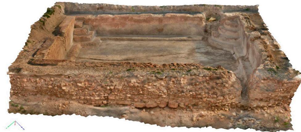
Figs. 9 a y b. Excavaciones en la natatio de las termas occidentales y modelo fotogramétrico.

estilo cerámico ilicitano y la creación de la colonia y su centuriación, atestiguada en la más antigua de las inscripciones romanas de la comunidad valenciana. Concluyó por fin, que la ciudad inició una evolución que alcanzaría la antigüedad tardía.