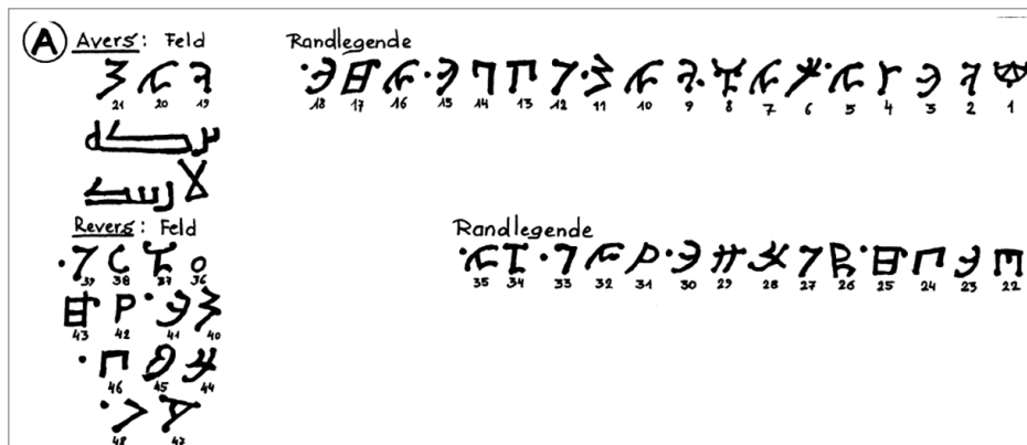
2. ábra A 817. évi pénzfelirat

udvari írássá emelésével jött létre, s korábbi változatai már a 6. századtól kezdtek megjelenni. Ezeket találjuk meg a nyugati ótörökség, elsősorban a Kazár Birodalom területén. A nyugati ótörökség emlékei közül is kiemelnék egy kazár pénzfeliratot, továbbá a nagyszentmiklósi kincs és a szarvasi tűtartó feliratait.