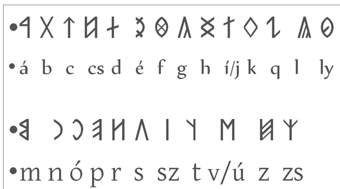
6. ábra 14. századi rovásábécé

Egyes rovásábécékben külön jele van a kemény és a lágy /h/-nak, a német ich- és ach- Lautnak, ez utóbbi a magyarban például a technika szóban fordul elő. Valójában azonban csak egy rovásbetűje volt a /h/ hangnak, a nikolsburgi ábécében előforduló, egymás fölé helyezett két x nem számítható külön betűnek. Ez eredetileg csak egy X jel volt, de több okból is az egymás fölé helyezett két x vált a fő alakká. Ha következetesen végigvisszük a 16. századi rovásábécé megtisztítását a másodlagos elemektől, előttünk áll a rovásábécé 14. század eleji rendszere (6. ábra).