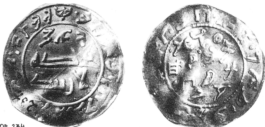
1. ábra A 817-es pénz