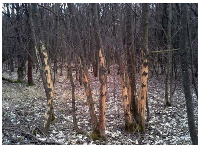
1. ábra Kiterjedt kéreghántás nyomai fiatal magas kőris ( Fraxinus excelsior ) példányokon Figure 1. Traces of extensive bark stripping on the trunks of young common ash ( Fraxinus excelsior ) trees

A Budakeszi környéki erdőkben 2016 tavaszán feltűnő, vélhetően kérődző vadtól származó kéreghántási sebeket figyeltünk meg a fákon (1. ábra). A kártétel mértéke (egyres helyszíneken több volt a meghántott, mint az ép kérgű fa) felkeltette érdeklődésünket, ám a hazai szakirodalomban csak néhány ide vonatkozó közleményt találtunk (Bence 1979, Walterné 1998, Nagy és Kámpel 2015, Fehér et al. 2016). Ezek alapján elsősorban a gímszarvasra ( Cervus elaphus ) és a dämvadra ( Dama dama ) gyanakodhattunk, de a muflon ( Ovis aries ) és az őz ( Capreolus capreolus ) lehetősége is felmerült. A kéreghántás okaként is több körülmény jöhet szóba, amelyek közül leggyakrabban a kéreg tápértékét és a bendőben zajló emésztési folyamatok segítségét emelik ki, de a vadállomány zavarása is lehet a kiváltó okok egyike (Walterné 1998, Rajský et al 2008, Fehér et al. 2016).