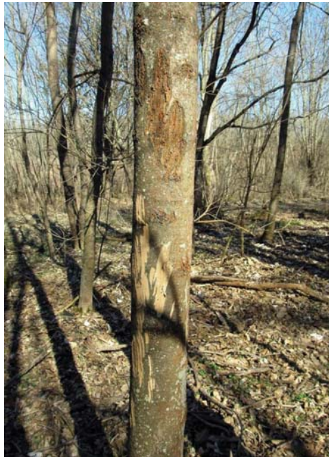
2. ábra Régebbi és friss hántásnyomok magas kőris ( Fraxinus excelsior ) törzsének felső, illetve alsóbb szakaszán

Budakeszi közelében, a város alsó végétől nyugatra eső térségben, öt kéreghántással sújtott mintaterületet választottunk ki, amelyekben egy-egy 10 m × 10 m-es kvadrátban, minden 2,5 cm-nél nagyobb mellmagassági átmérővel rendelkező, élő fa egyedet megvizsgáltunk. Az egyes példányok faji azonosítása után, ha nagyvadra utaló hántásnyomokat láttunk rajta, mérőszalaggal lemértük a meghántott rész alsó és felső magassági határát, valamint feljegyeztük, hogy a hántás ideje eredetű-e, vagy korábbi években keletkezett (2. ábra). A vizsgálat évében történt hántásnak tekintettük a világos színű, fehér vagy sárgásfehér sebeket, amelyek szélén a sebgyógyulás még nem indult meg. Ezeken gyakran nedvszivárgás is megfigyelhető volt, amin olykor rovarok (többnyire hangyák) is táplálkoztak. Régebbi hántásnak az olyan sebeket jegyeztük fel, ahol a hántott felszín be barnult, és a szélein kalluszosodást lehetett megfigyelni.