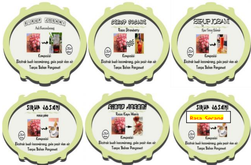
Gambar 3. Label Minuman Kecombrang Aneka Rasa