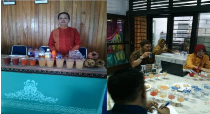
Gambar 5. Prototipe Model Minuman Hasil Uji Laboratorium II dan Uji Organoleptik

Pengujian organoleptik dilakukan terhat hasil ujicoba laboratorium dan hasil praktek pelatihan dengan sensasi dari rasa, aroma, tekstur dan warna dengan keterlibatan panca indera berdasarkan kriteria tertentu.