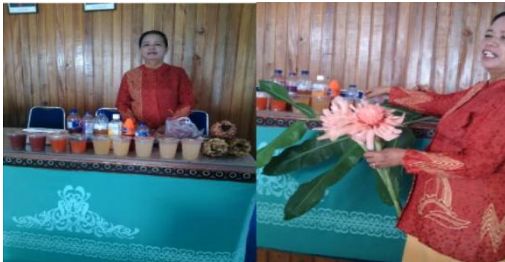
Gambar 2. Sirup Kecombrang Aneka Rasa hasil uji laboratorium sebagai prototipe model produk