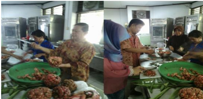
Gambar 4. Penelitian eksperimen di Laboratorium

Prosedur penelitian dirancang dua tahun. Tahun pertama (2015): penelitian laboratorium, untuk memperbaiki mutu produk, menguji formula yang tepat untuk prototype model , memperbaiki mutu, label, kemasan, dan merancang bahan ajar serta mengembangkan model pelatihan dan pemberdayaan masyarakat, ujicoba, validasi, revisi, dan pelatihan tahap awal. Melaksanakan pelatihan dan pemberdayaan di dua Kecamatan. Tahun kedua: Pelaksanaan pelatihan lanjutan dan pemberdayaan masyarakat untuk industri rumah tangga, budidaya tanaman kecombrang, evaluasi dan diseminasi. Proses penelitian dilaksanakan sesuai tahapan Model Joke hasil pengembangan mulai dari laboratorium sampai pelatihan dan diseminasi.