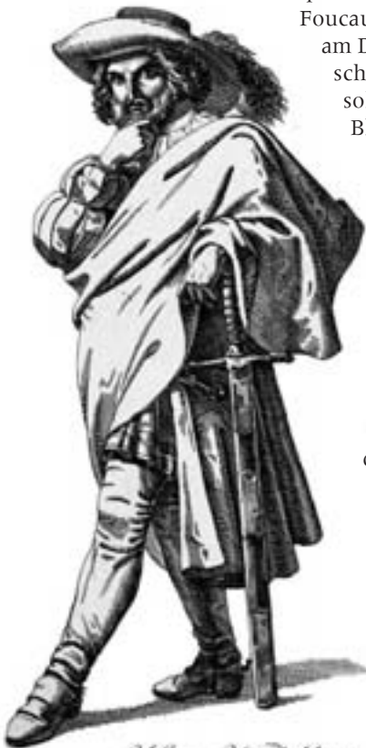
Hans Kohlhaas Reykhamm-Bürger von Danzig. Hingerichtet daselbst 1540. Mantel nach Salovey. „Nicht an uns liegt es, das man uns sehen.“ „Was! Nicht das man uns erschalten soll sich.“