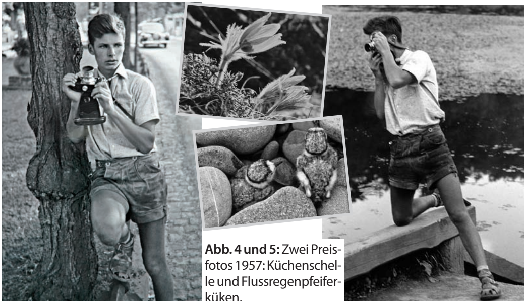
Abb. 4 und 5: Zwei Preisfotos 1957: Küchenschelle und Flussregenpfeiferküken.