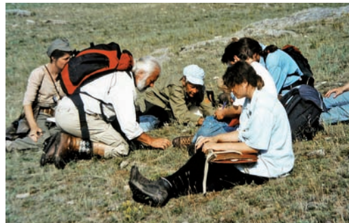
Abb. 9: HHB im Pribaikalsky Nationalpark den Pflanzen auf der Spur. Juli 1999.

Es ist unmöglich, im Rahmen dieser schriftlichen Laudatio alle wissenschaftlichen Leistungen von HHB darzulegen. Den besten Eindruck erhält man durch die Liste seiner Publikationen, die zahlreiche Bücher sowie Arbeiten in fachwissenschaftlichen und populärwissenschaftlichen Zeitschriften und