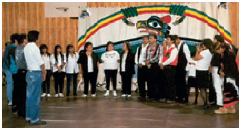
Frauen der Huupach'as'ath nehmen für einen Tanz Aufstellung, der ein traditionelles Fest abschließt, bei dem eine Familie eine große Anzahl von Gästen bewirte hat. Solche Feste stehen an der Nordwestküste Amerikas in der Tradition eines weitläufigen Umverteilungssystems in dem adlige Familien regelmäßig ihren Wohlstand teilten und damit ständig gegenseitige Verbindlichkeiten erneuerten sowie sich der Loyalität der Nichtadligen versicherten. Kompromisslose Freigebigkeit bis an den Rand des ökonomisch Möglichen gilt heute den Stammesmitgliedern allgemein als anzustrebendes, »typisch indianisches« Verhaltensideal.