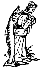
Nur echt mit dieser Marke — dem Garantie- zeichen des Scotts- laien-Verfahrens!

Scotts Emulsion ist nur echt, wenn die äußere Packung nebenstehende Fische- schutzmarke aufweist, auf die beim Einkauf immer zu achten ist.