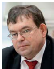
Prof. Dr. Hartmut Leppin , 47, studierte Geschichte, Latein, Griechisch und Erziehungswissenschaften in Marburg, Heidelberg und Pavia. 1988 erfolgte das Erste Staatsexamen für das Lehramt an Gymnasien in Geschichte und Latein, 1990 wurde er in

Seine Promotionsschrift »Citizens and aliens: foreigners and the law in Britain and the German states, 1789 – 1870« erschien im Jahr 2000. Auf eine Beschäftigung am Deutschen Historischen Institut London folgte 2001/2002 die Habilitation an der Goethe-Universität. Die Habilitationsschrift »Ehrbare Spekulant: Stadtverfassung, Wirtschaft und Politik in der City of London (1688 – 1900)« erschien 2003. 2004 trat er eine Professur an der Universität zu Köln an. Seit 2006 ist er Inhaber der Professur für Neuere Geschichte unter besonderer Berücksichtigung des 19. Jahrhunderts an der Goethe-Universität. Fahrmeir ist Principal Investigator am Exzellenzcluster »Die Herausbildung normativer Ordnungen« und federführender Vertrauensdozent der Studienstiftung des deutschen Volkes. Er gehört zum Beirat der »Historischen Zeitschrift« und zu den Herausgebern der »Sehepunkte«.