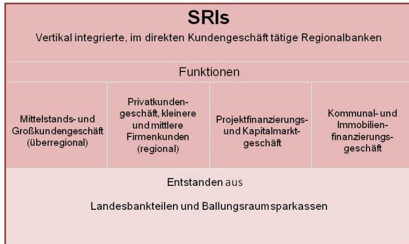
Schaubild 2: Funktionen und Bestandteile der SRIs