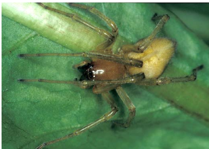
Abb. 1: Weibchen von Cheiracanthium mildei . Aufnahme aus Aurisina, Südtirol. 2.7.1993.

Die Zahl der mitteleuropäischen Spinnenarten, deren Biss beim Menschen nennenswerte Folgen verursachen kann, wird zwischen einer und sieben angegeben (SCHMIDT 1987, 1993, SACHER 1990, FOELIX 1996, LEMKE 2005). Am bekanntesten und berüchtigtsten ist zweifellos der Ammen-Dornfinger Cheiracanthium punctatorium (Villers, 1789). Seit der ersten Meldung dieser Art für Deutschland durch BERTKAU (1891), die auch gleich mit der Schilderung eines Bisses mit „ungemein heftig brennender“ Schmerzwirkung einherging, ist es nach einzelnen verbürgten Vorfällen regelmäßig zu Wellen von Panik und Hysterie gekommen, die von Pressemeldungen weiter angefacht wurden. So geriet der Dornfinger nach Bissverletzungen in Rheinhessen bereits 1979 in „bisher nicht bekanntem Maße ins Interesse der Öffentlichkeit“ (GRASSHOFF 1979). Unvergleichlich ist jedoch die Dornfinger-Hysterie in Österreich im