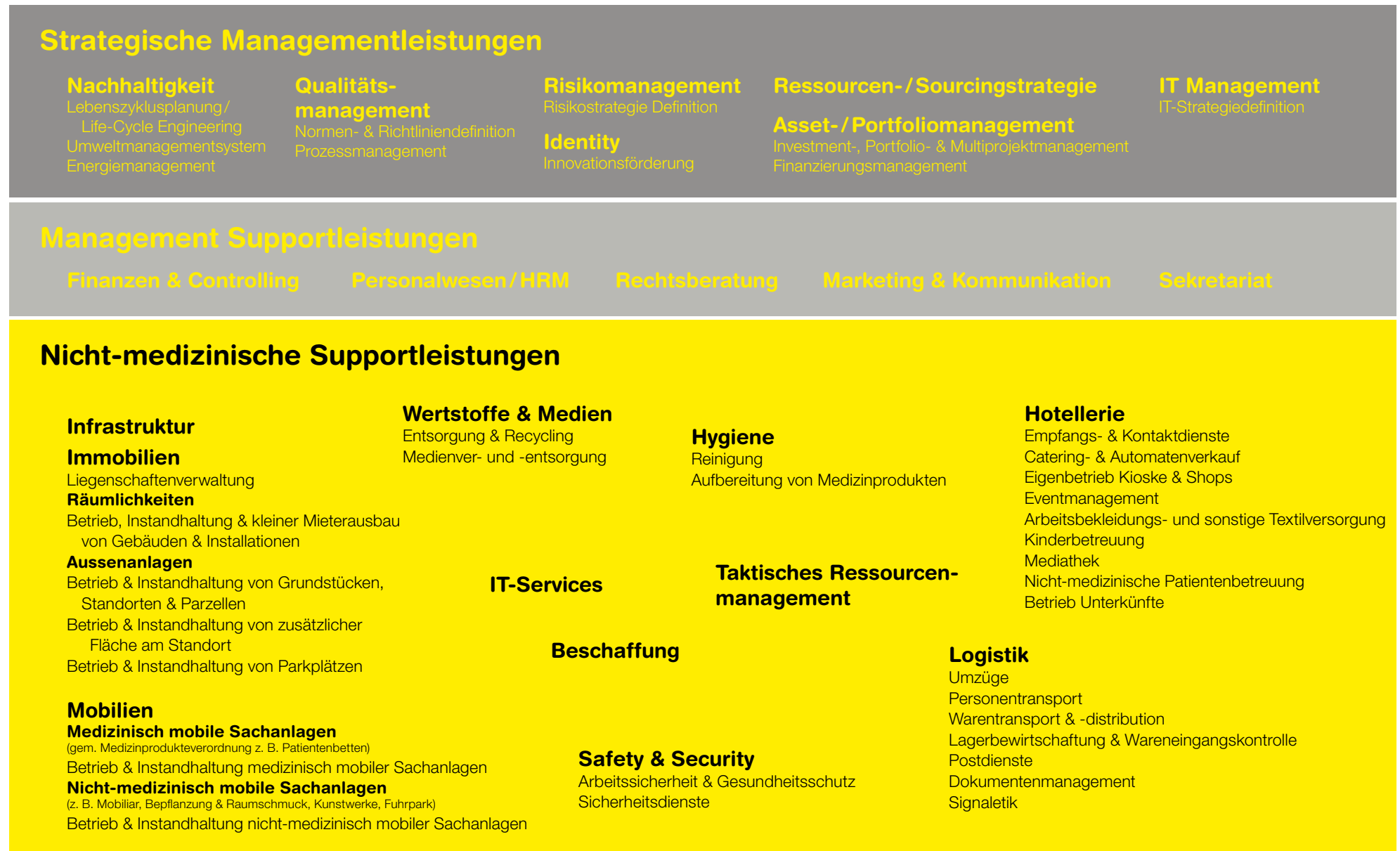
Abbildung 3: Leistungszuordnungsmodell für nicht-medizinische Supportleistungen (LemoS)