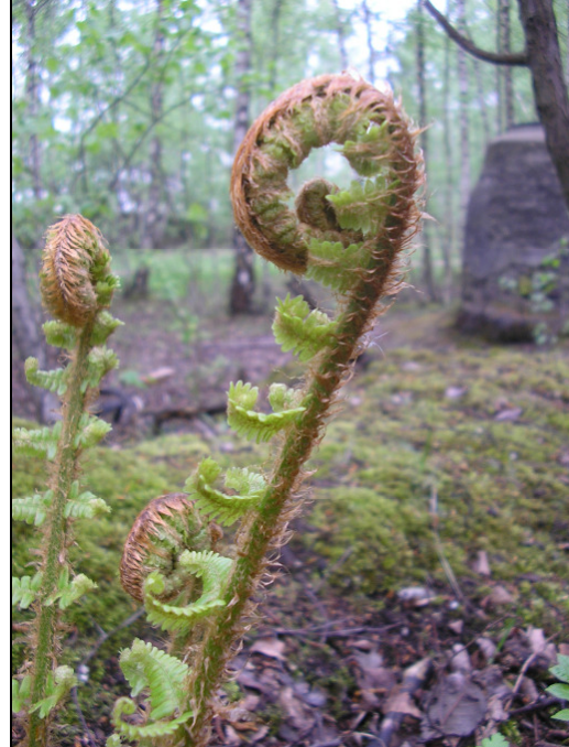
Abb. 3: Bereits die sich ausrollenden, jungen Wedel ("Bischofsstäbe") von Dryopteris affinis s. l. sind dicht mit Spreuschuppen besetzt, wie hier am Exemplar im Landschaftspark "Pluto-Wilhelm" (MTB 4408/44) (04/2009, P. GAUSMANN)