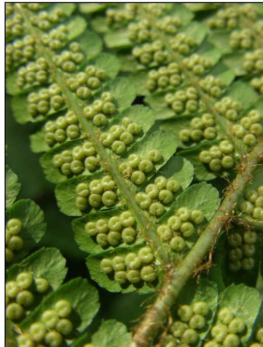
Abb. 5: Mit Spreuschuppen besetzte Rhachis sowie junge Sporangien von Dryopteris affinis s. l. am Fundort im NSG "Langeloh" in Herne (MTB 4409/42) (06/2008)