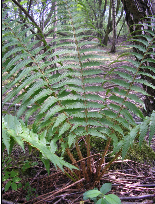
Abb. 2: Ein Stock von Dryopteris affinis s. l. in einem lichten Birken-Pionierwald im Landschaftspark "Pluto-Wilhelm" in Wanne-Eickel (MTB 4408/44) (06/2008)

einzelnen Sippen des Dryopteris affinis -Komplexes zu verschaffen. Interessant bleibt zu beobachten, ob die unterschiedlichen Sippen auch ein unterschiedliches ökologisches Verhalten zeigen oder sogar ein eigenes Areal ausbilden.