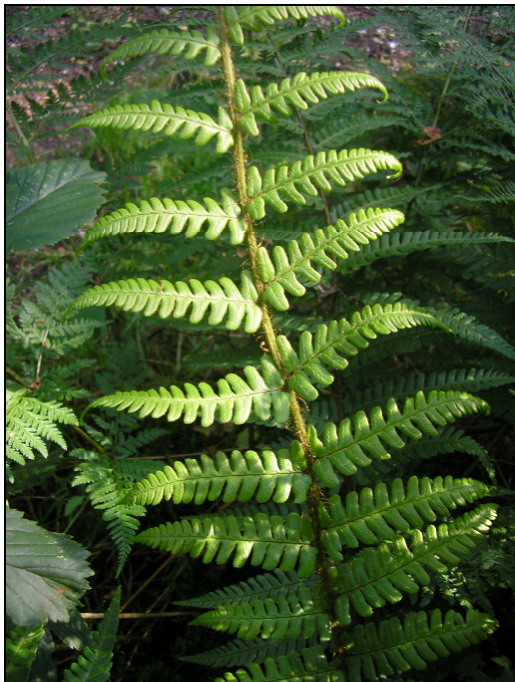
Abb. 4: Kümmerlich entwickelte Einzelpflanze von Dryopteris affinis s. l. am Fundort in Niederkrüchten (MTB 4703/33) (06/2008)