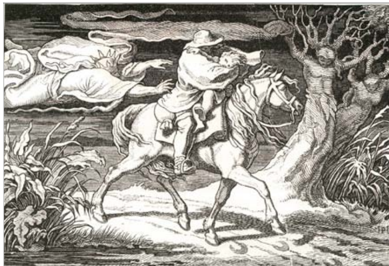
Illustration von Hermann Plüddemann

Oben: Ludwig Grote: Die Brüder Olivier und die deutsche Romantik (Forschungen zur deutschen Kunstgeschichte; 31) Berlin: Rembrandt-Verlag 1938. Abbildung Nr. 216 auf S. 336. | Unten: Die Brüder Olivier. Gemälde, Zeichnungen und Druckgraphik aus der Staatlichen Galerie Dessau. Ludwigshafen a.Rh., Wilhelm-Hack-Museum 1990. Illustrationen zum Erbkönig (um 1835), Nr. 72-73. Hier Nr. 73, Abbildung S. 77.– Ferdinand Olivier lebte von 1785 bis 1841.