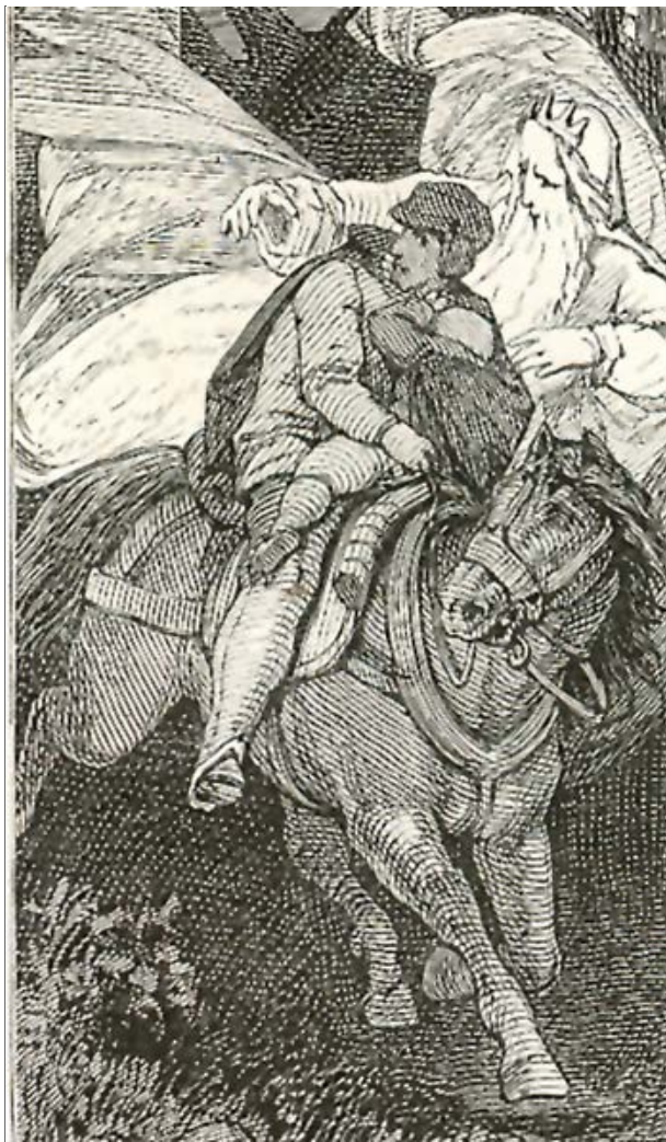
Friedrich Bodenstedt (Hrsg.): Album deutscher Kunst und Dichtung

Album deutscher Kunst und Dichtung. Hrsg. von Friedrich Bodenstedt. Mit Holzschnitten, nach Zeichnungen der Künstler, ausgeführt von R. Brend'amour und Anderen. 4., umgearbeitete Aufl. Berlin: Verlag der G. Grote'schen Verlagsbuchhandlung 1877. Hier S.180.