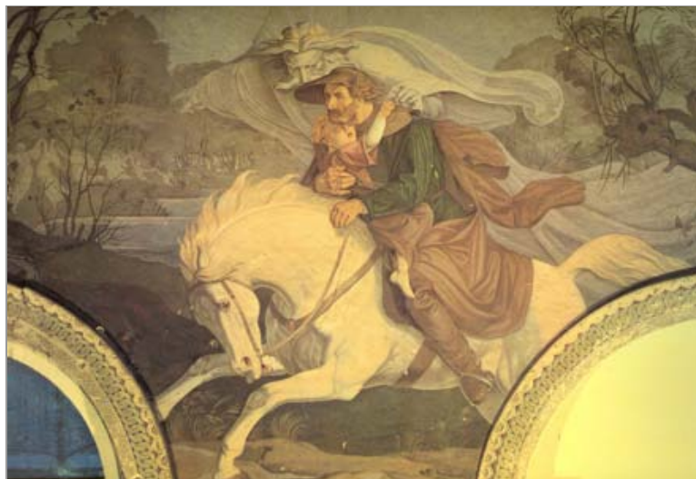
Carl Gottlieb Peschel: Erlikönig (1840; Ausschnitt). Dittersbach, Belvedere Schönhöhe

Zum Vergrößern klicken Sie bitte auf das Bild.