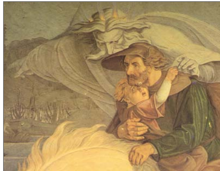
Ausschnitt aus dem Fresko von Carl Gottlieb Peschel