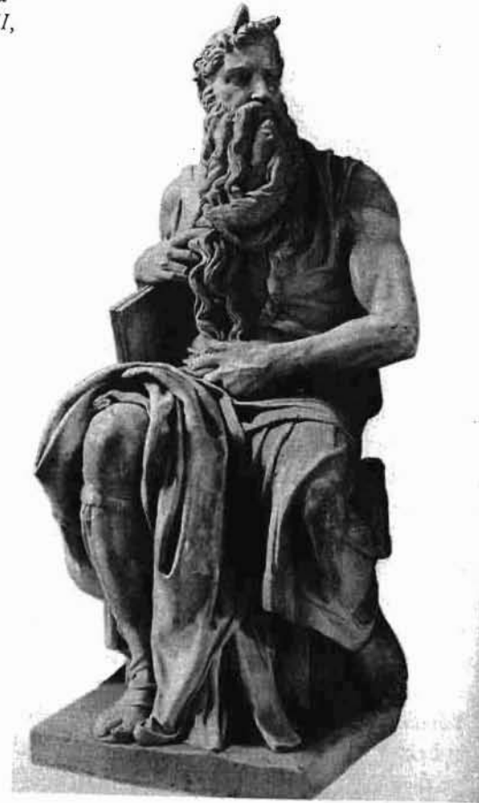
Abb. 1: Michelangelo: Moses-Statue. Grabmal für Papst Julius II, Kirche S. Pietro in Vincoli, Rom

Hier kommt es – genau wie beim Fußabdruck, den Robinson Crusoe zu interpretieren hat – zu einer bemerkenswerten Interferenz von Symbol und Symptom: Die im Bild dargestellten Themen werden zu kulturellen Symptomen für symbolische Prozesse. Das heißt erstens: Sie verweisen als Symptome darauf, dass zu bestimmten Zeiten bestimmte Themen so und nicht anders dargestellt wurden. Zweitens repräsentieren die dargestellten Themen als Symbole die Ideen und Ideologien einer bestimmten Kunstperiode. Die entscheidende Frage ist nun, wie diese Interferenz zwischen kulturellen Symptomen und »symbolischen Formen« 43 zu denken ist, wie sich von dem Symptom auf das Symbol zurückschließen lässt. Cassirer geht davon aus, dass es so etwas wie ein vorbegriffliches Symbolbewusstsein gibt, das »der Wahrnehmung und Anschauung seinen Stempel aufdrückt«. 44 Der Abdruck des Stempels wäre dann das kulturelle Symptom einer symbolischen Form mit