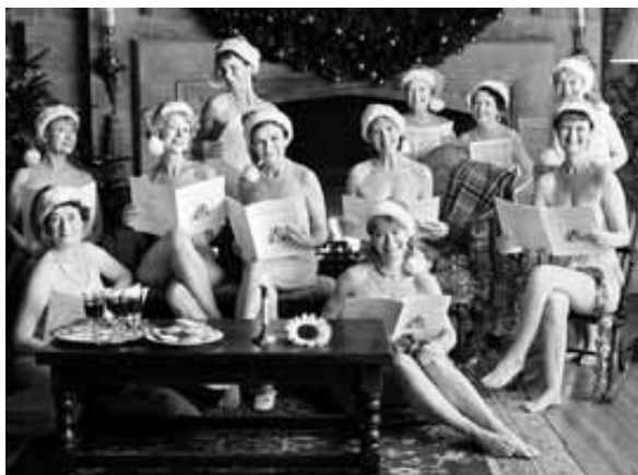
Aus dem Spielfilm „Kalender Girls“

Der vorliegende Film greift auf eine wahre Begebenheit zurück. Chris und Annie sind seit Jahren beste Freundinnen bis Annes Ehemann an Leukämie stirbt. Als Chris die Idee hat, für den Frauenverein den alljährlichen Kalender mit Nacktaufnahmen von älteren Frauen aus dem Ort zu produzieren, um damit Geld für das örtliche Krankenhaus zu sammeln, bringt diese ausgefallene Idee nicht nur die kleine Stadt in Aufruhr.