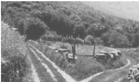
Aus der Diareihe „Wege“ (Verleihnummer 100305)

Setzen Sie z.B. Dias zur Einstimmung oder zum Abschluss einer Veranstaltung ein. Oder Sie können selber Reihen aus verschiedenen Diasammlungen anlegen, z. B. Thema Lebensweg, Geborgen- oder Einsamsein, Abschied nehmen, Neues wagen, das Fremde usw.