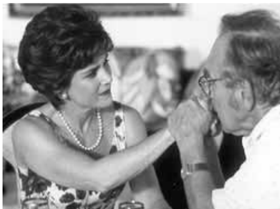
Aus dem Kurzfilm „Späte Liebe - Old Love“

20 Min., D, 2000, Kurzspielfilm Der Film fragt, warum der Mensch geboren wird und warum er sterben muss. Er erzählt die Geschichte vom alten Harry Bendiner und seiner neuen Nachbarin Ethel. Die beiden fühlen sich gleich bei ihrem ersten und einzigen Aufeinandertreffen stark zueinander hingezogen. Obwohl Ethel erst vor kurzem ihren Mann verloren hat, macht sie gemeinsame Pläne für ein Leben mit Harry.