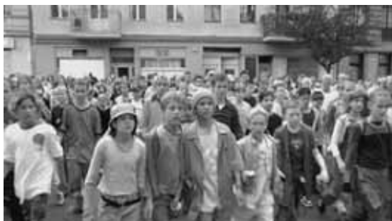
Aus dem Spielfilm „Emil und die Detektive“ (Verleihnummer 4300656)

Großeltern und Enkel lachen und bangen zusammen im Kino, eine Schulklasse lädt das benachbarte Altenheim zum gemeinsamen Filmerleben ein: zwei Beispiele aus dem generationsübergreifenden Kino für Jung und Alt. Da locken Klassiker des Kinderfilms von damals kleine und große Kinofans in die Vorführungen. Junge und alte