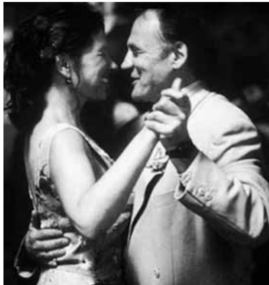
Aus dem Spielfilm „Brot und Tulpen“

fon – doch für Rosalba beginnt ein neues Leben, eine Auszeit, in der ihre Missgeschicke abnehmen und ihr Glück wächst.