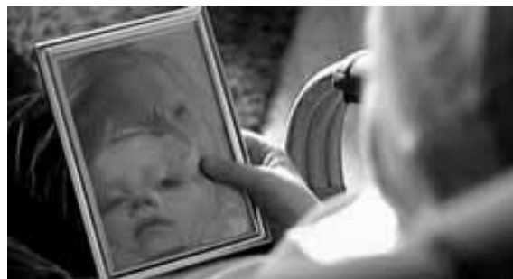
Aus dem Kurzfilm „Tytönen“

Mann, der sie "Mutter" nennt. Der finnische Kurzfilm zeigt auf eine liebevolle Art und Weise die Beziehung zwischen Jung und Alt - Traum und Realität.