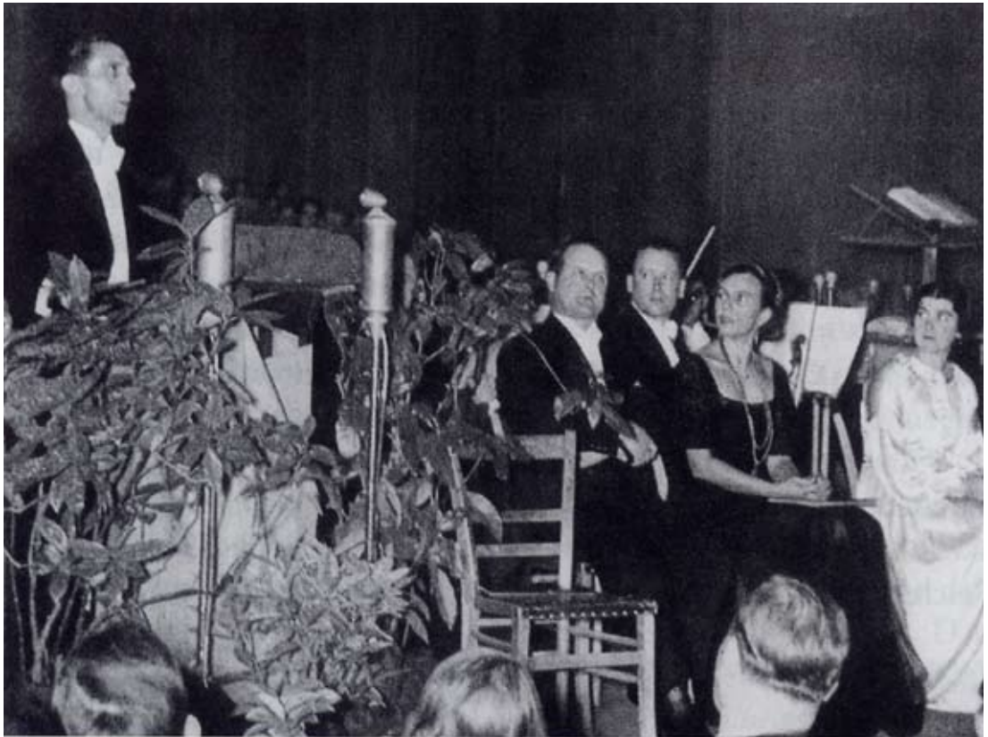
Gedenkfeier zu Schillers 175. Geburtstag am 10. November 1934 im Deutschen Nationaltheater Weimar, Reichspropagandaminister Goebbels bei seiner Gedenkrede

(Joseph Goebbels: Rede zur Schiller-Gedächtnisfeier in Weimar am Sonnabend, dem 10. November 1934. Zitat nach Georg Ruppelt: Schiller im nationalsozialistischen Deutschland. Der Versuch einer Gleichschaltung. Stuttgart 1979, S. 154-156.)