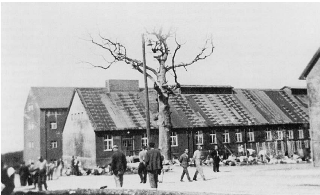
Konzentrationslager Buchenwald, „Goethe-Eiche“, Mai 1944

(Ernst Wiechert: Der Totenwald. Ein Bericht. Zürich und München 1946, S. 64.)