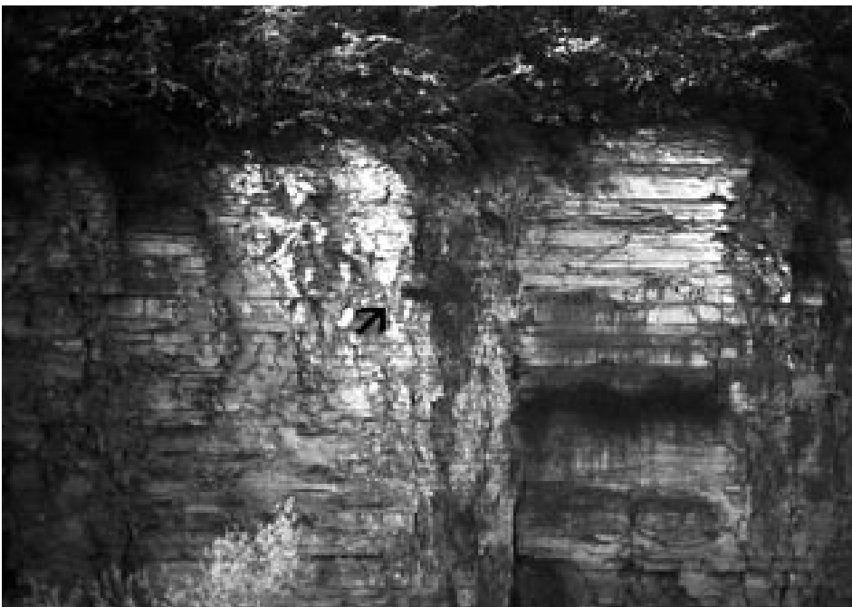
Abb. 1: Nest des Mäusebussards Buteo buteo in einer Steinbruchwand bei Geseke. 28.04.2005. – Cliff nest of Common Buzzard Buteo buteo in a quarry near Geseke, North Rhine-Westphalia, Germany. 28.04.2005.

Auch wenn außerhalb der Alpen in weiten Teilen Mitteleuropas Felsen fehlen, gibt es zumindest gebietsweise sowohl natürliche als auch anthropogene Felsfor-