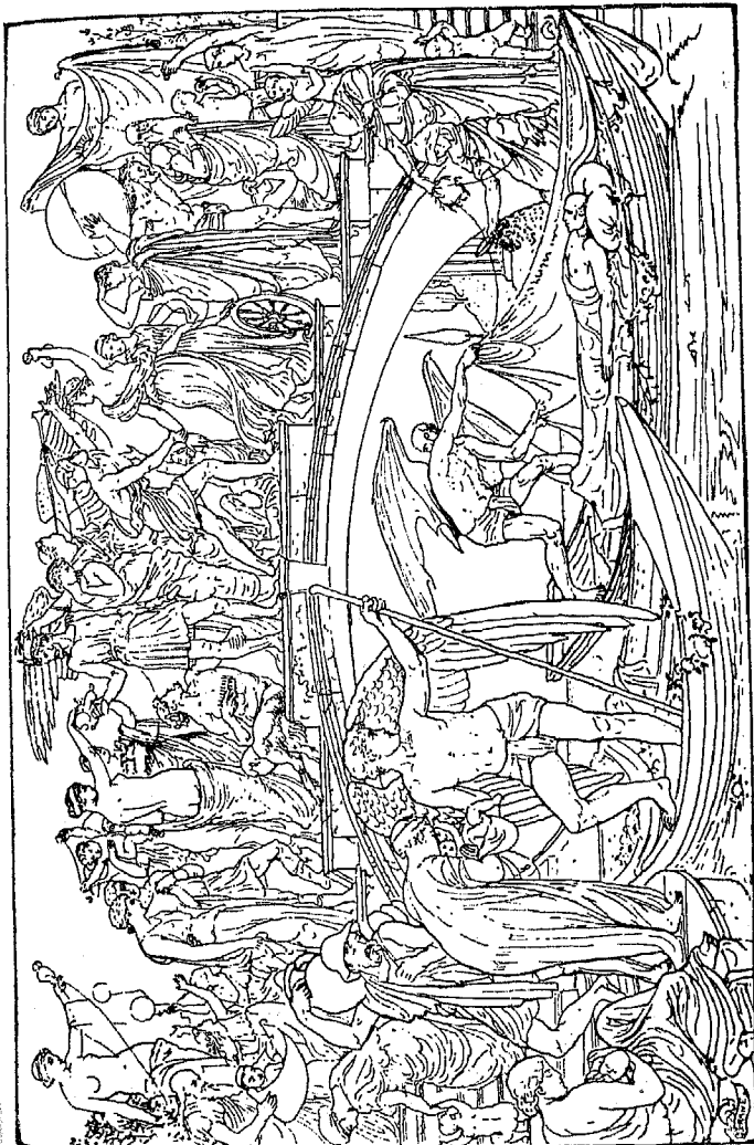
Die Brücke des Lebens.

In den englischen Kinderbüchern hatten bis dahin grelle Farben, oberflächliche Zeichnung und ein roher Naturalismus geherrscht. In Verbindung mit dem hervorragenden Holzschneider und Drucker Edmund Evans schuf Walter Crane eine neue, eigenartige Illustrationsweise mit kräftigen Umrissen in einfacher, entschiedener Zeichnung mit der Feder oder dem Pinsel und in wenigen harmonischen, flach behandelten Farben. Die Figuren stehen, lebhaft charakterisiert, auf reich gefülltem Hintergrunde, in so grossem Maassstab gezeichnet wie es der gegebene Raum und die Gesetze der Perspektive nur irgend gestatten, so dass eine geschlossene, dekorative Gesamt-