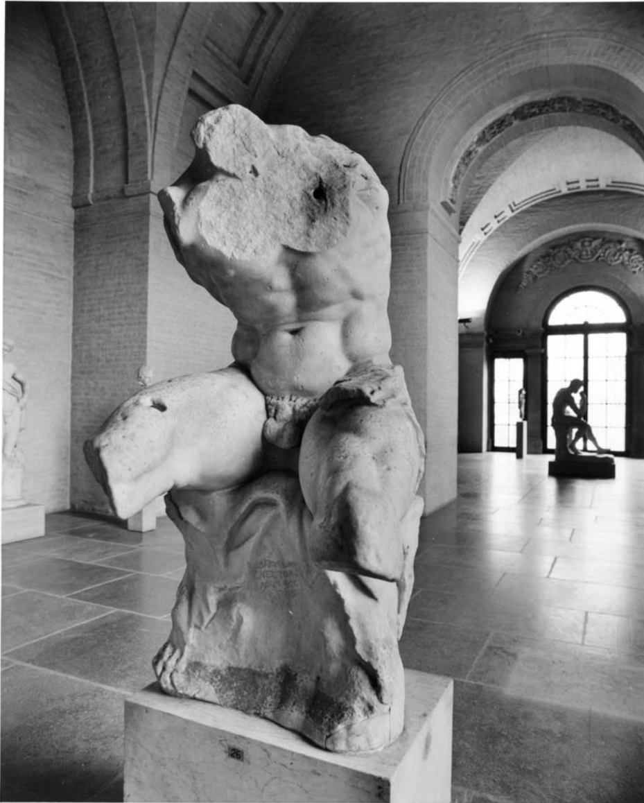
Abb. 1: Torso vom Belvedere. Vatikanische Museen.

Foto aufgenommen während der Münchner Ausstellung 1998; die Rekonstruktion der Skulptur ist im Hintergrund sichtbar. Ich danke den Staatlichen Antikensammlungen und Glyptothek München für die Reproduktionserlaubnis.