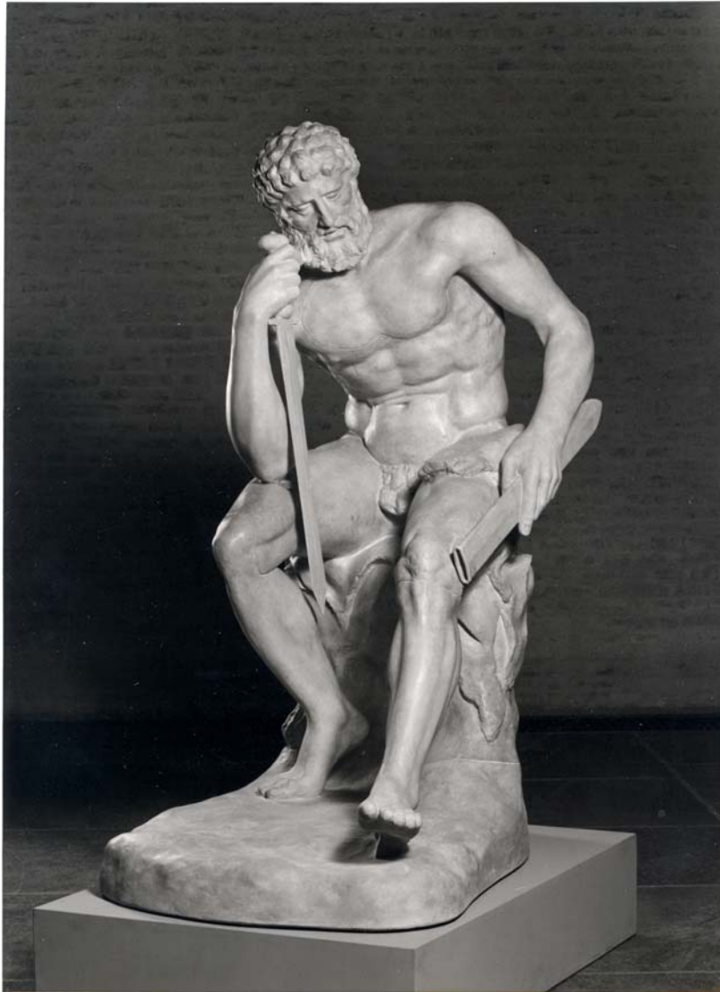
Abb. 3: Torso vom Belvedere. Rekonstruktion von Raimund Wünsche, München 1998.

Ich danke den Staatlichen Antikensammlungen und Glyptothek München für die Reproduktionserlaubnis.