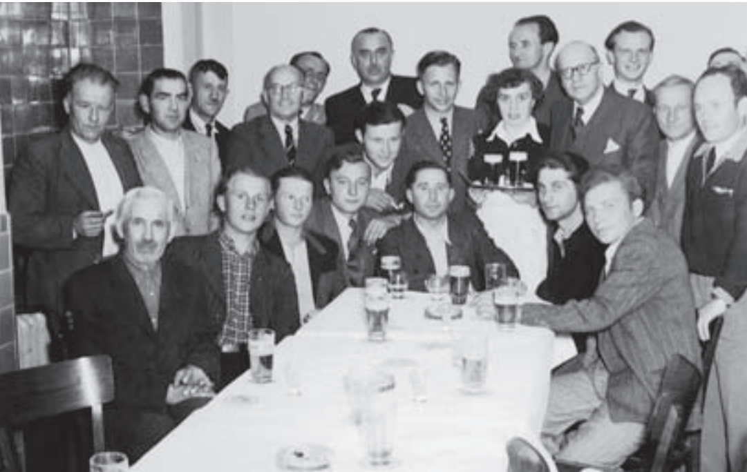
Das Institut für Sozialforschung lud am 5. Juni 1951 zum Richtfest seines Neubaus ein und zum anschließenden gemütlichen Beisammensein bei Rippchen und Bier in der Mensa der Universität. Max Horkheimer steht rechts von der Frau, die zwei Biergläser trägt. Das 1924 gegründete Institut für Sozialforschung wurde 1933 geschlossen und 1951 in Frankfurt wieder eröffnet.

der US-amerikanischen Soziologie weltweit eine führende Rolle zukam, die bis in die 1970er Jahre Bestand hatte. Anschließend konnten im Gefolge der 1968er-Bewegung insbesondere die verschiedenen Repräsentanten der »Frankfurter Schule der Soziologie« auf sich aufmerksam machen. Aber auch die zum Teil in der deutsch-