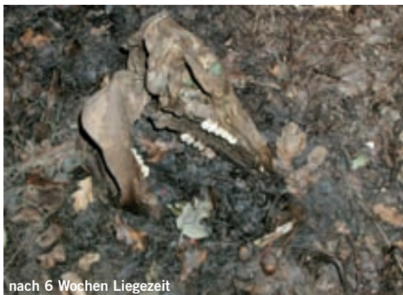
Verwesungsstadien bei Schweinekadavern.