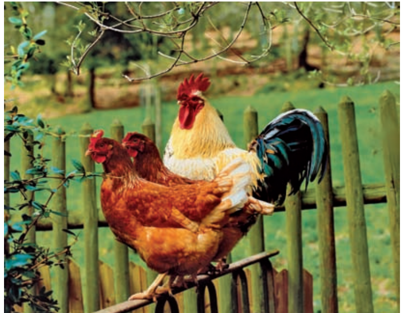
Haushühner, die sich nur in einem begrenzten Radius bewegen, haben die gleichen Anlagen zur Orientierung in ihrem Oberschnabel wie Vögel, die weite Strecken zurücklegen.

Um diesen Beweis anzutreten, haben die Wissenschaftler Tausende von Vergleichsuntersuchungen und -messungen vorgenommen: Zunächst wird dazu das Gewebe des Oberschnabels mikroskopiert und untersucht, wo sich in dem Gewebe eisenhaltige Substanzen befinden, anschließend vergleichen die Forscher diesen histologischen Befund mit den Ergebnissen der physikochemischen Analysen. Die aufwendigen Studien mit hochauflösenden topografischen Röntgenstrahlen wurden am Speicherring DORIS III bei DESY durchgeführt. »Der Schnabel kann hier mit speziellen Röntgenstrahlen zerstörungsfrei untersucht werden, um genau