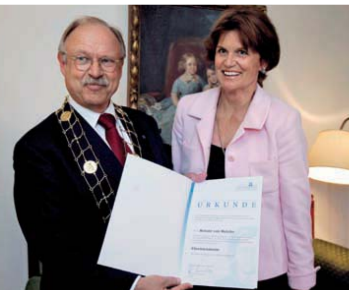
von Gunter Stemmler

Ein Erinnern an Ehrenbürger und Ehrensensoren