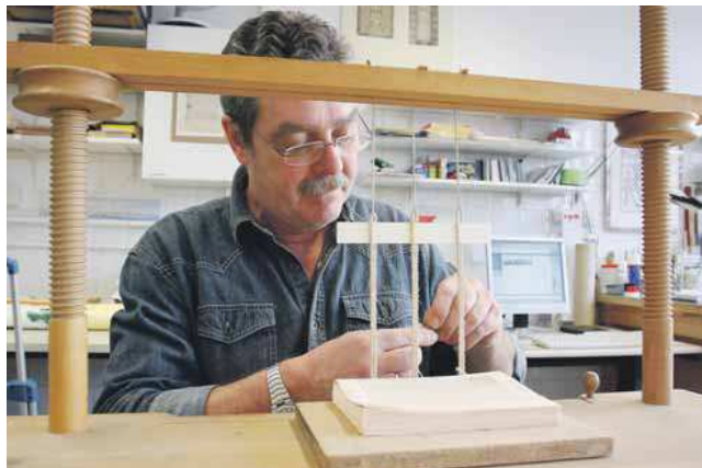
Oben: Buchpressen sind ein wichtiges Hilfsmittel der Restauratoren, wenn es um Reparaturen an den historischen Beständen (rechts) der Bibliothek geht.

Doch nach 1945 gewinnt die Universitätsbibliothek rasch wieder an Bedeutung. Sie übernimmt Landesaufgaben. In Frankfurt wird die ‚Hessische Bibliotheksschule‘ eingerichtet, der ‚Hessische Zentralkatalog‘, zahlreiche Sondersammelgebiete und die Bibliographie der Deutschen Sprach- und Literaturwissenschaft. 1964 wird der Neubau an der Bockenheimer