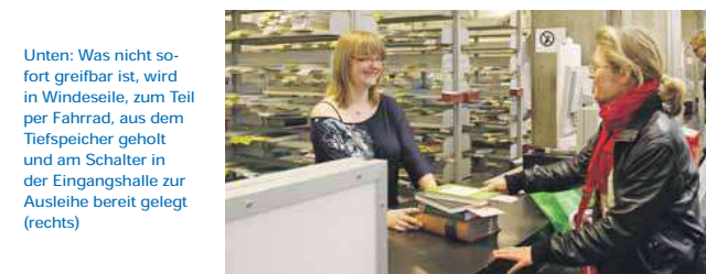
Unten: Was nicht sofort greifbar ist, wird in Windeseile, zum Teil per Fahrrad, aus dem Tiefspeicher geholt und am Schalter in der Eingangshalle zur Ausleihe bereit gelegt (rechts)