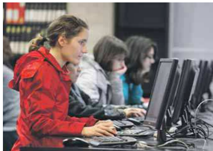
Links: Für die schnelle Recherche im Bibliotheksbestand stehen zahlreiche Computer zur Verfügung.