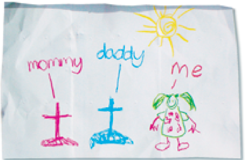
Zeichnung eines Kindes, das durch AIDS beide Eltern verloren hat. Eine Nichtregierungsorganisation in Lesotho machte daraus ein Präventionsplakat.

Wie HIV haben auch andere Infektionserkrankungen globalen Charakter. Um diesem gerecht zu werden, ist das Institut für Medizinische Virologie am Frankfurter Universitätsklinikum schon seit langem sowohl unter humanitären als