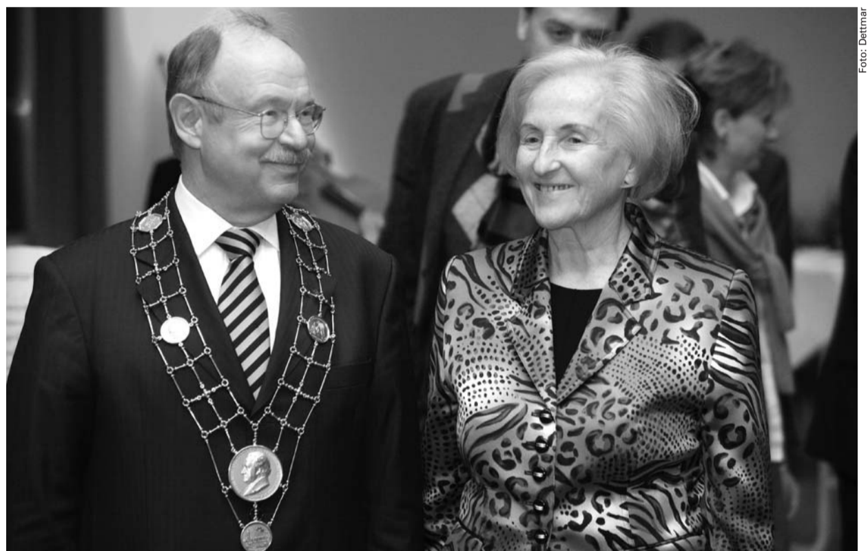
Eine großzügige Mäzenin und ein glücklicher Präsident: Johanna Quandt unterstützt seit Jahrzehnten die Behandlung krebskranker Kinder am Klinikum der Universität und richtet jetzt eine Professur am Frankfurt Institute for Advanced Studies (FIAS) ein