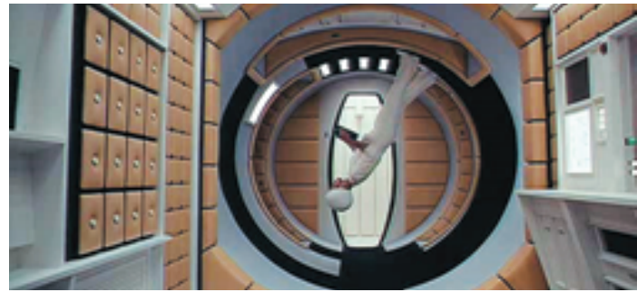
2 Still aus: Stanley Kubrick, »2001 – A Space Odyssey«, 1968.