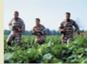
2 Still aus: Joel und Ethan Coen, »O Brother, Where Art Thou?«, 2000, mit (von links nach rechts) John Turturro, Tim Blake Nelson und George Clooney.

sind sie in der Lage, den Schauplatz jederzeit wieder zu verlassen und abrupt gegen einen anderen in einem anderen Kapitel desselben oder eines ganz anderen Buchs einzutauschen. Eben solche sprunghaften Wechsel zwischen Szenen, Zeiten und Welten wurden von jeher als typisch für den Videoclip erachtet: Ein zwischen verschiedenen Orten und Kulturen hin- und herspringender Michael Jackson führte dies bereits 1991 in dem von Hollywood-Regisseur John Landis gedrehten Video zu »Black or white« in Perfektion vor. Und so überrascht es fast nicht, dass der Schriftsteller Fforde seine künstlerische Prägung als Kameramann erfahren hat.