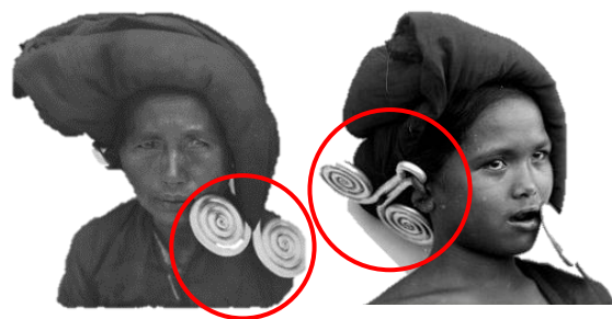
Gambar 5. Cara penggunaan padung-padung yang unik: bagian ujung dimasukkan ke lubang telinga kiri dengan posisi ke bawah, sedangkan pada telinga kanan posisinya menghadap ke atas. Untuk mengurangi beban, kain penutup kepala diselipkan pada bagian yang lain dari perhiasan tersebut.

Pendapat lain menyatakan bahwa padung-padung diberikan sebagai hadiah dari keluarga pihak pengantin laki-laki kepada pengantin wanita (Rodgers, 1988). Cara pemakaian padung-padung berbeda antara telinga sebelah kanan dengan telinga sebelah kiri yaitu pada bagian telinga kanan di gunakan ke arah belakang dengan posisi agak naik dan pada telinga bagian kiri padung-padung menghadap ke depan dengan posisi lebih rendah. Hal ini ternyata mengandung makna implisit yang melambangkan kehidupan sebuah perkawinan yang tidak selamanya berjalan mulus. Selalu akan timbul kondisi yang senang (disimbolkan dengan posisi padung-padung ke atas) dan susah (disimbolkan dengan posisi padung-padung ke bawah). Oleh karena itu dalam sebuah kehidupan perkawinan, sepasang suami istri harus saling mendukung (Rodgers, 1988).