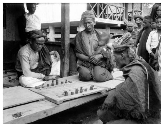
Gambar 3. Para lelaki suku Karo menghabiskan waktunya dengan bermain catur di kedai-kedai minuman yang banyak dijumpai pada masa itu, yaitu sekitar tahun 1914-1919