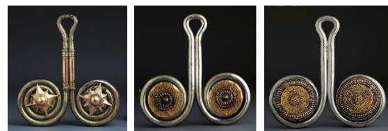
Gambar 6, 7, 8. Material terbuat dari perak disepuh emas atau suasa (gbr 6) atau perak tanpa sepuhan (gbr 7, 8) berat 1,5 - 2 kg, panjang 15,5 cm, menggunakan bentuk bintang sebagai ornamen (gbr 6), ada juga yang menggunakan teknik granulasi pada bagian ornamen.

Selain bentuk spiral yang sederhana pada padung-padung ternyata ditemukan juga padung-padung dengan ornamen di atasnya. Hal ini terjadi karena permintaan para pemesannya yang menginginkan desain yang berbeda pada padung-padung yang akan dikenakannya dan biasanya bahan bakunya disediakan oleh pemesan tersebut (Sibeth, 1991). Material yang digunakan untuk membuat padung-padung adalah emas jenis suasa dan perak. Material perak sebagai bahan baku yang digunakan untuk membuat padung-padung berasal dari mata uang logam Spanyol, Mexico, maupun Jepang yang banyak dijumpai pada masa itu yaitu pada abad 19-20 (Sibeth, 1991). Hal tersebut terjadi karena kualitas perak pada uang-uang logam tersebut cukup baik untuk dilebur menjadi perhiasan.