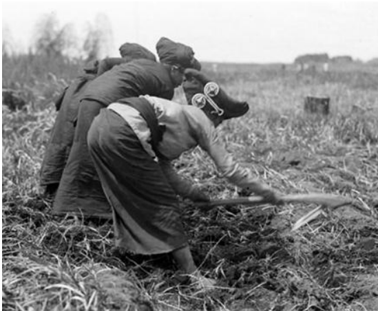
Gambar 4. Salah satu kegiatan rutin yang dilakukan wanita Karo adalah bercocok tanam.

Wanita Karo secara tradisional memiliki peranan yang sangat penting dan peranan yang tidak penting. Yang dimaksud dengan peranan yang sangat penting misalnya dalam banyak hal, wanita adalah penentu kebijaksanaan seperti dalam hal kebersihan rumah tangga, pendidikan, sosialisasi, anak, dan penentu dalam usaha pertanian (memilih bibit, waktu tanam, panen, dan lain-lain), dukun beranak, dan guru sibaso. Sementara peranan yang tidak penting adalah bahwa peranan wanita dalam adat Karo dianggap hanya sebagai pelengkap saja, tidak bisa lepas atau berdiri sendiri. Hal ini disebabkan karena wanita Karo harus tunduk pada peraturan adat sehingga dalam beberapa hal kedudukannya lebih rendah daripada pria. Dalam menjalankan aktivitas keseharian mereka, wanita Karo di masa lalu melakukan kegiatan-kegiatan tersebut secara bersama-sama. Hal tersebut karena kuatnya jiwa gotong royong yang telah tumbuh secara turun temurun dari nenek moyang mereka.