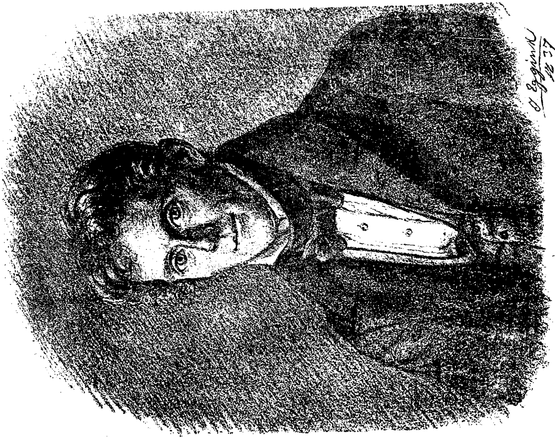
Johann Gottlieb Fichte.