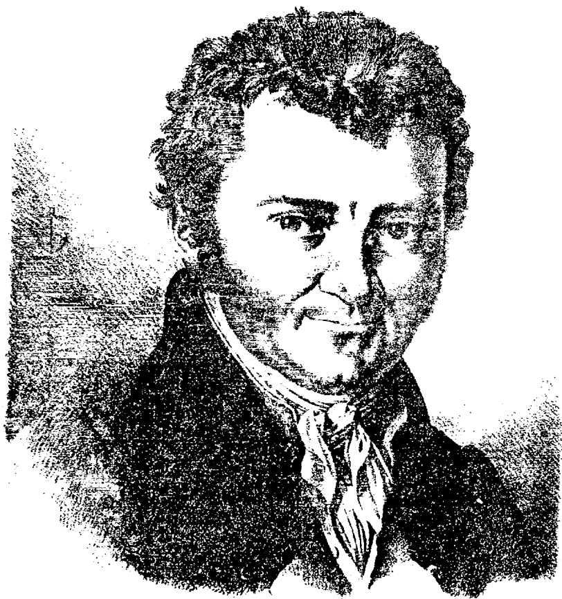
IOH. NICOL. HEINRICH LICHTENSTEIN.