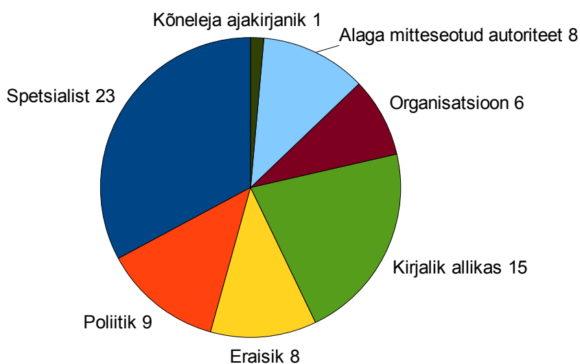
Joonis 3.2 Kõnelejad

Tartu rahu teemadel kõnelejate ja allikate hulgas oli kõige rohkem spetsialiste.