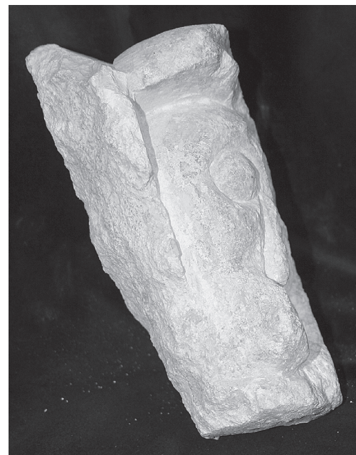
4. Reljef iz Knežinca / The Knežinec relief

Prilikom nedavne obnove fasade, uključile smo se, kao nadležni konzervatori, te smo pregledale (pomoću skele) cjelokupno crkveno ziđe, u fazi kad je sa crkve bila skinuta