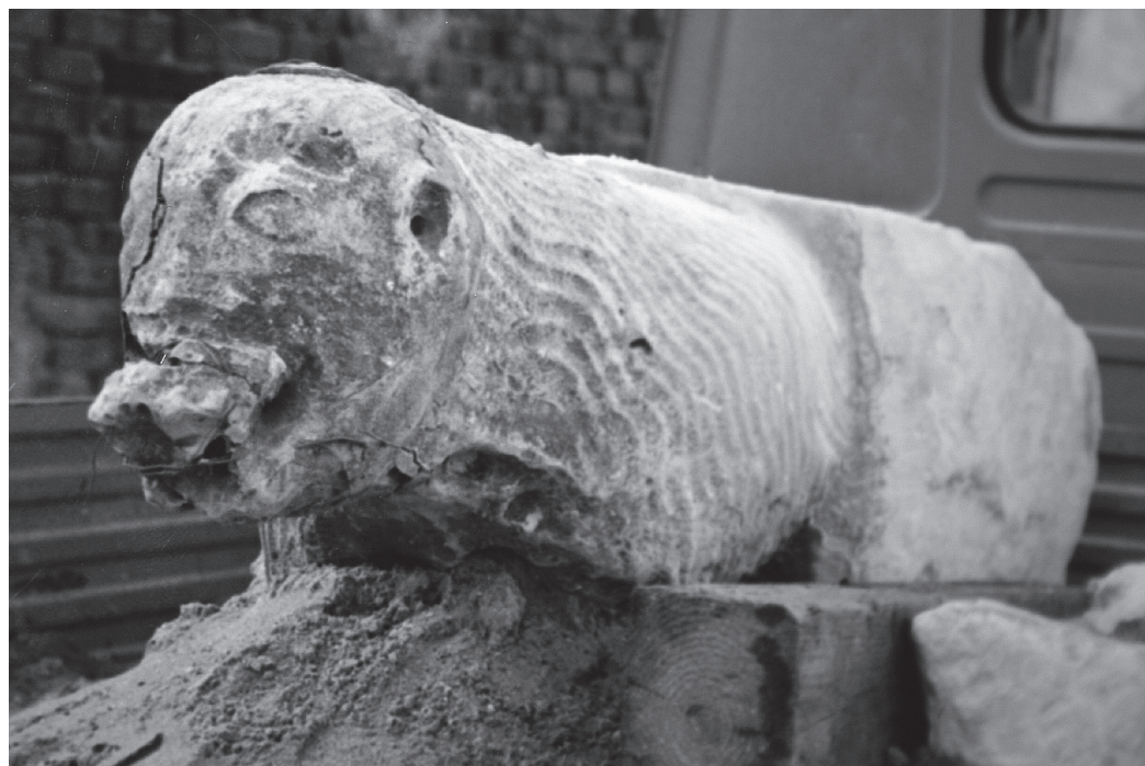
7. Varaždin, skulptura medvjeda, prije obnove / Varaždin, sculpture of a bear, before restoration

Još se jedna zanimljiva kapela nalazi u blizini Varaždina, koja također ima ugrađene spolirane srednjovjekovne elemente. Riječ je o kapeli sv. Marije Magdalene u Viničnom, općina Visoko na južnom dijelu Varaždinske županije.