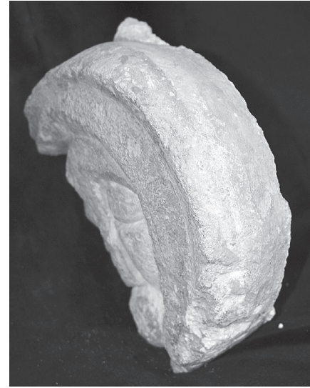
3. Reljef iz Knežinca / The Knežinec relief

pravilne je orijentacije. Smještena je na platou, unutar neka- dašnje utvrde. Građena je potkraj 15. i početkom 16. stoljeća u stilu gotike. To je jednobrodna, longitudinalna građevina, s poligonalnim svetištem nižim i užim od lađe. Svetište je od lađe odvojeno šiljastim trijumfalnim lukom. Nekada je trijumfalni luk bio znatno niži nego što je to današnji. 6 Prozor u svetištu danas je zazidan iznutra, i može se vidjeti samo s vanjske strane. Kameni elementi prozora očuvani su s obje strane i završavaju šiljastim lukom, koji u vrhu prelazi u trolist. Na južnom zidu crkve također je ostao djelomič- no očuvan gotički kameni okvir prozora velikih dimenzija,