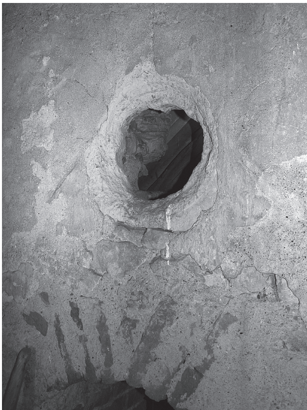
9. Vinično, kapela sv. Marije Magdalene / Vinično, chapel of St. Mary Magdalene