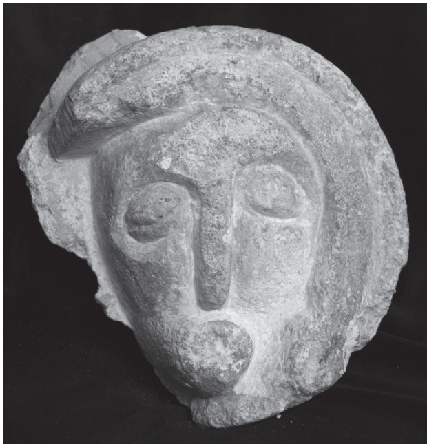
2. Reljef iz Knežinca / The Knežinec relief

šiljastog luka, danas zazidan. Zvonik je prislonjen sa sjever- ne strane svetišta. Ulaz u crkvu bio je sa zapadne strane, i ispred ulaza nalazio se drveni trijem. Godine 1800. crkva je produžena sa zapadne strane, te vjerojatno da je dogra- đen trijem sa sjeverne strane, pa je tada crkva dobila svoj današnji oblik. Knežinečka župa osnovana je 1789. godine, i prvi župnik je prilikom dolaska u Knežinec sedam godina i deset mjeseci stanovao u knežinečkoj kuli.