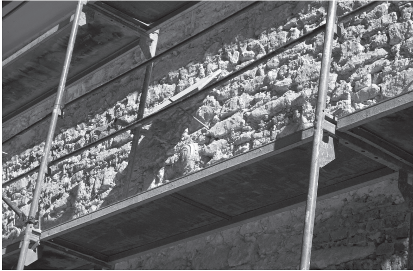
1. Gornji Knežinec, crkva sv. Marije Magdalene, južno pročelje nakon skidanja žbuke / Gornji Knežinec, church of St. Mary Magdalene, south façade after removing the plaster