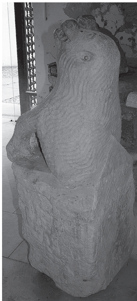
8. Varaždin, skulptura medvjeda odostraga (foto: V. Pascuttini-Juraga) / Varaždin, sculpture of a bear from behind (photo: V. Pascuttini-Juraga)