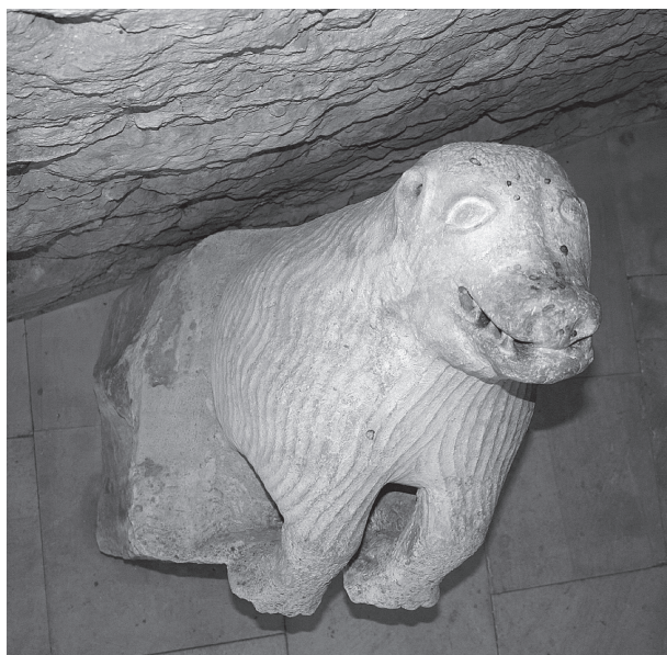
6. Varaždin, skulptura medvjeda, pogled odozgora / Varaždin, sculpture of a bear, view from above

Nakon pregleda skulpture i komparacijom sa sličnim materijalom, zaključile smo da je skulptura medvjeda zaista mogla biti dio romaničkog portala, i to jedini njegov ostatak, očuvan kroz stoljeća samo zahvaljujući graditeljima gotičkog tornja koji su ga ugradili visoko u zidu tornja kao spomenik ranijim razdobljima gradnje crkve. Kao takvog, može ga se datirati u rano 13. stoljeće. 14