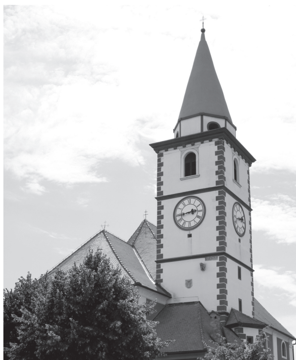
5. Varaždin, crkva sv. Nikole, toranj / Varaždin, church of St. Nicholas, bellfry

pa u Zábóří, Češkoj, koja je datirana oko 1150. godine. 9 Što se tiče Mađarske, zasad nismo uspjeli pronaći ništa slično reljefu iz Knežinca. Na temelju dosadašnjih istraživanja i usporedbi, smatramo da bi se kneginečki reljef moglo datirati u drugu polovinu 12. i početak 13. stoljeća, iako su potrebna još daljnja istraživanja, kako bi se to sa sigurnošću i potvrdilo. Nadamo se da će buduća istraživanja kako crkve, tako i njezina okoliša, otkriti moguće starije slojeve, očuvane bar u arheološkom sloju.