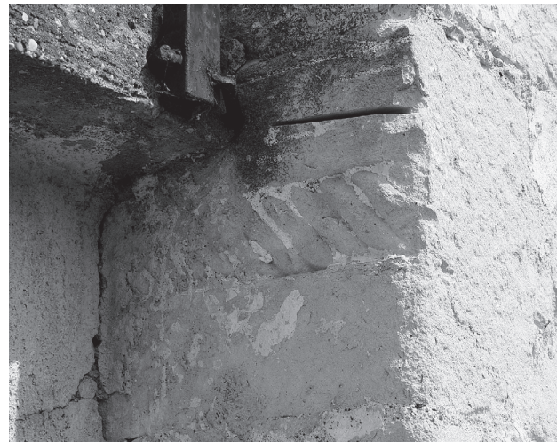
12. Vinično, portal / Vinično, portal