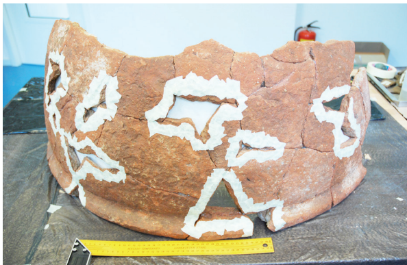
3. Dolija br. 2 tijekom restauratorskih radova

upotrijebljene su metalne šipke od inoksa (trnovi) dužine oko 7 cm. Trnovi su lijepljeni epoxi ljepilom u prethodno izbušene rupe na mjestima koja su najbolje mogla podnijeti prodiranje u strukturu keramike bez uzrokovanja vidljivih oštećenja. (sl. 2) U ovom slučaju korišteno je dvokomponentno epoxi ljepilo Epox 2000. Nedostatak epoksidnih ljepila je njihova ireverzibilnost i, s vremenom, promjena boje pa se u pravilu njihova upotreba u konzervatorsko-restauratorskoj djelatnosti izbjegava. Ipak, u pojedinim slučajevima kada je potrebno snažno povezivanje pojedinih fragmenata, epoksidna su ljepila, zbog izuzetne čvrstoće, ušla u upotrebu restauratorske struke (HAMILTON, 1999: File 2, 6). Radi održavanja pravila reverzibilnosti konzervatorsko-restauratorskih procesa, u našem slučaju trnovi su lijepljeni epoxi ljepilom samo u jednom od dvaju fragmenata koja su se spajala, i to u pravilu u donjem fragmentu, onom koji nosi većinu težine. Drugi dio inoks trnova spajan je reverzibilnim ljepilom Mecosan L-TR, koje je posebno razvijeno za lijepljenje keramičkih ulomaka. To se ljepilo upotrebljavalo i prilikom međusobnog spajanja fragmenata, a svojom čvrstoćom zadovoljavalo je zahtjeve konzervatorsko-restauratorskih