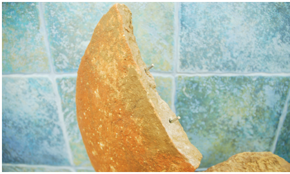
2. Pojačanja od inoks trnova na doliji br. 1

Reinforcement bars made of stainless steel in dolium No. 1