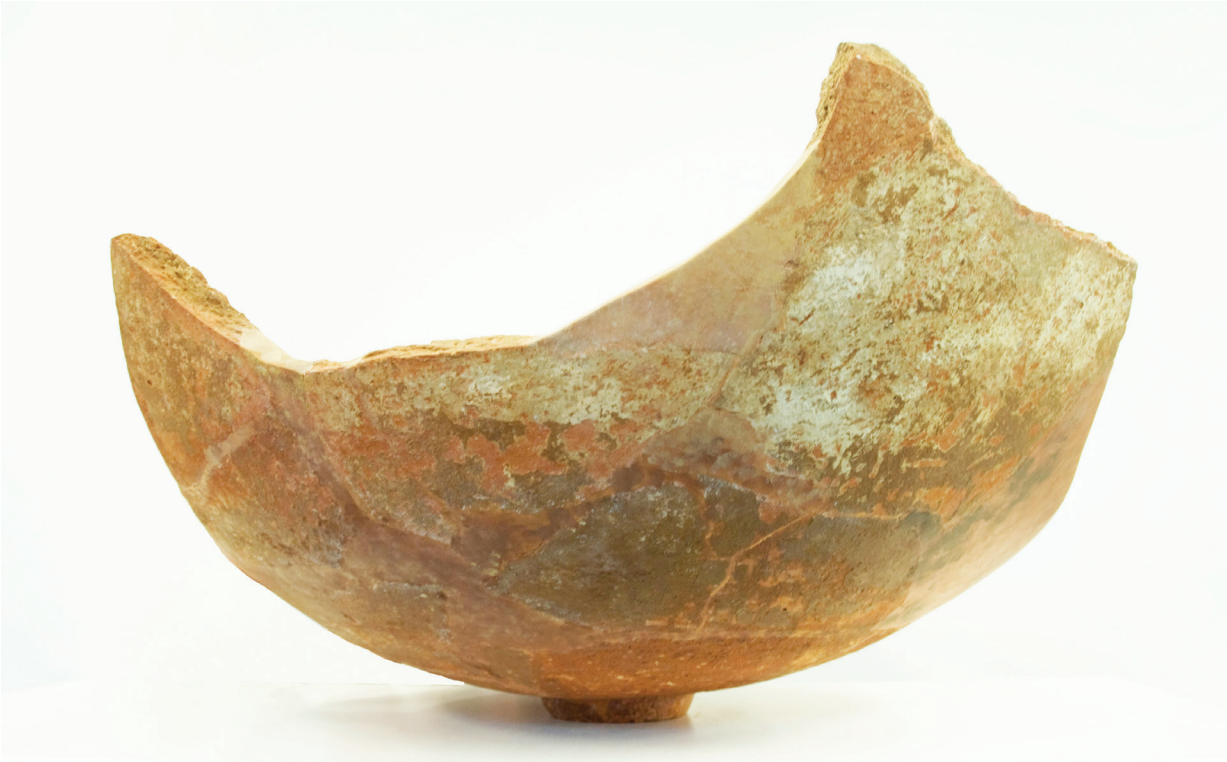
5. Dolija br. 1 nakon izvedenih konzervatorsko-restauratorskih radova Dolium No. 1 after the conservation-restoration works