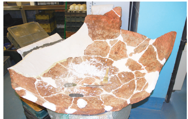
4. Donji dio dolije br. 1 tijekom restauratorskih radova

Lower part of dolium No. 1 during the restoration