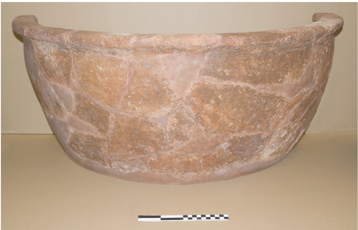
6. Dolija br. 2 nakon izvedenih konzervatorsko-restauratorskih radova (vanjska strana) Dolium No. 2 after the conservation-restoration works (exterior)