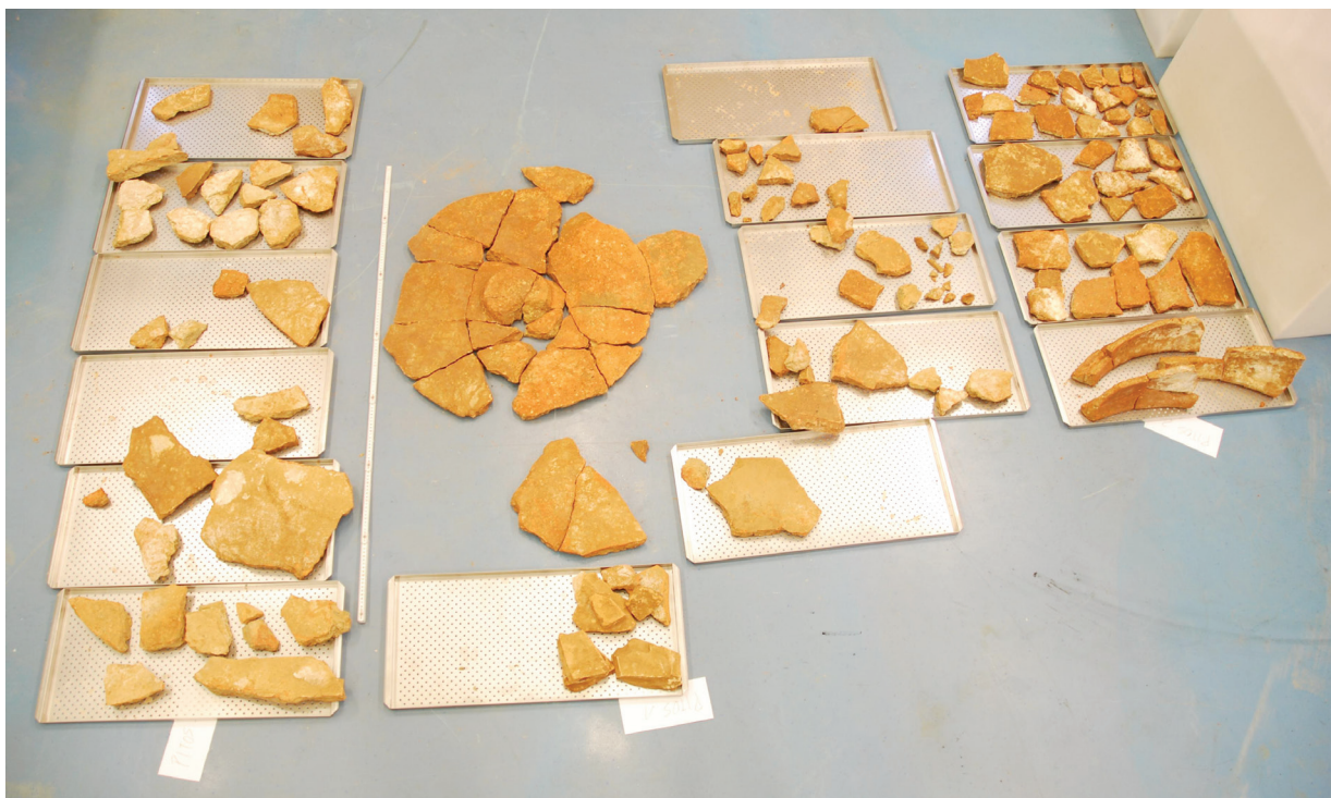
1. Fragmenti dolija prije konzervatorsko-restauratorskih radova Dolia fragments prior to the conservation-restoration works

školjaka ili puhova (JURIŠIĆ, 1997: 166; BRENNI, 1985: 26). Iako se ta vrsta posuda izrađivala u raznim dimenzijama, postoje dva osnovna tipa: manji do 110 cm visine i veći, do 200 cm visine (BRENNI, 1985: 188–190; KIRIGIN, 2007: 135). Najčešće dimenzije dolija koje nalazimo u gospodarskim objektima bile su visine oko 150 cm, širine oko 150 cm, s otvorom posude oko 70 cm. Taj tip posude u velikom broju možemo naći i u našim krajevima, a najčešće je povezan s antičkim gospodarskim objektima 1 .