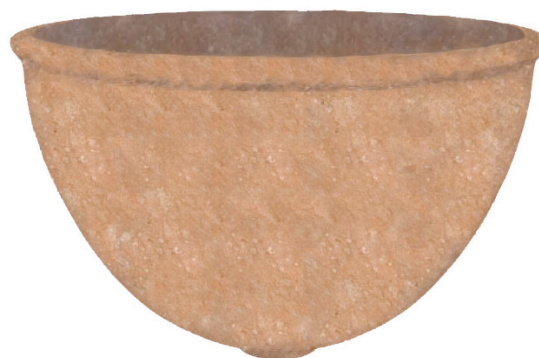
8. Idealna rekonstrukcija dolije br. 2 (dokumentacija HRZ-a, izradili D. Vujević, M. Pešić) Ideal reconstruction of dolium No. 2 (HRZ documentation, drawing by D. Vujević, M. Pešić)

projekt. Iako su dolije samo djelomično rekonstruirane, obavljani zahvati iziskivali su konzultacije sa stručnom restauratorskom i arheološkom literaturom, kao i inovativne priručne radove da bi se posao kvalitetno obavio. Tijekom radova vodilo se računa o poštivanju etike struke, obavljane su samo potrebne intervencije, poštovana je reverzibilnost procesa te se nije mijenjao karakter samih predmeta. Cijeli proces je opsežno dokumentiran.