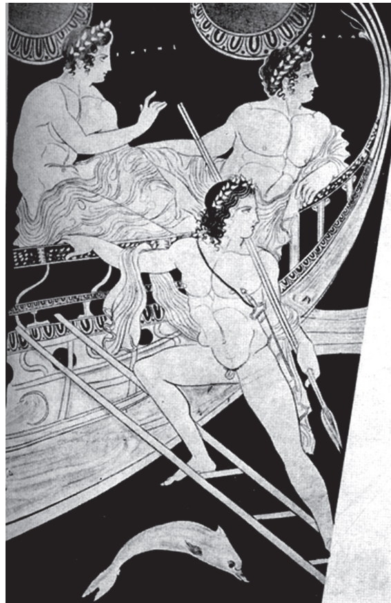
Figure 2. Le navire Argô dans l'épisode de Tâlos. Détail du cratère de Ruvo, d'après : MORRISON, WILLIAMS 1968, pl. 26a.

Sur la première reconstitution proposée en 1936 par Pierre de la Coste-Messelière, le navire de forme un peu tronquée, occupait deux métopes. Plus récemment François Salviat 16 a démontré qu'il pouvait en occuper trois (Fig. 1). Cette hypothèse, qui fait de l'Argô une pentécontore 17 navire long de guerre entre 30-35m, à cinquante rameurs, correspond davantage aux bateaux en gloire 18 à l'époque de la construction du trésor de Sicyone, mais également aux textes qui mentionnent le navire des Argonautes. La tradition écrite fixe d'ailleurs à cinquante le nombre de héros qui ont participé à l'expédition, ce qui renvoie au même nombre de rameurs. Suivant Lucien Basch 19 l'Argô de la métope du trésor de Sicyone serait une dière, dont il reste deux sabords de nage dans le fragment de droite : "La distance de ces sabords, au plat-bord est si considérable qu'une seconde rangée de rames s'appuyait vraisemblablement sur des tolets fixés au sommet de la muraille". Les boucliers ne pouvaient demeurer là où nous le voyons, pendant la vogage, puisqu'ils auraient empêché le passage des rames du rang supérieur.