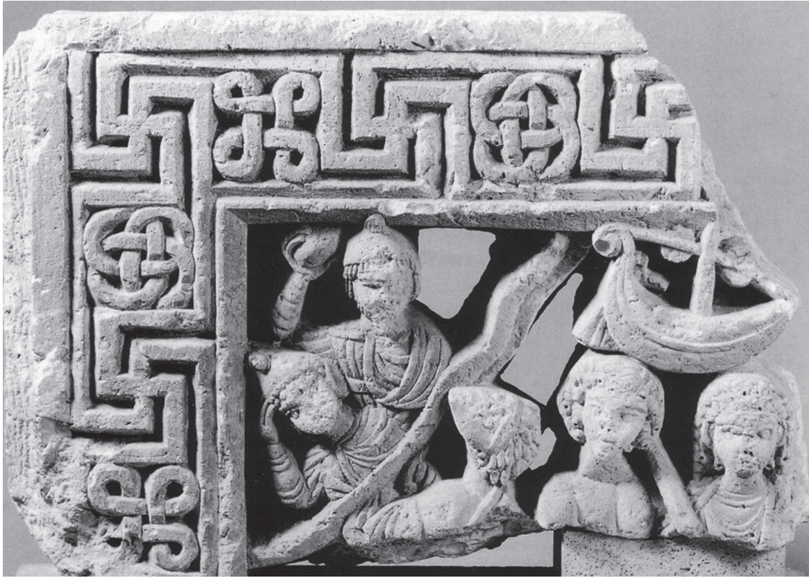
Figure 5 : Le navire Argô dans l'épisode de la conquête de la toison d'or. Relief du musée d'Art et d'Histoire de Genève.

tification du navire comme une trière, mais il voit dans ce cercle entre les deux préceintes un dalot, une ouverture située à peu de hauteur au-dessus de la flottaison, pour laisser s'écouler l'eau. Les rames ont été retirées, ce qui est normal pour un navire tiré au sec. On remarque la taille disproportionnée des personnages par rapport au navire, qui fait partie des conventions esthétiques. Mais cette image pose pour l'instant des problèmes aux spécialistes. En effet, si le pont est soutenu par des étais recourbés et l' apostis par des étais rectilignes dessinés à intervalle régulier, en revanche le rôle des étais courbes, situés sous l' apostis au niveau des sabords supérieurs, reste confus. Sur ce vase, le bateau mythique Argô ne peut qu'inciter à faire le lien avec les activités maritimes, naissantes au début du Vème siècle à Athènes, qui ont vraiment transformé le destin de la cité.