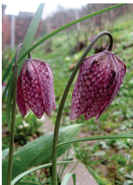
Slika 1. Fritillaria orientalis Adams

odsjeci: 42 c,d i 43 d,g, nadmorska visina cca. 550 m (45°28'16.07" N, 17°38'18.47" E). Biljka raste na kamenjarskom travnjaku u prorijeđenoj šumi hrasta medunca, rijetko je nazočna, na površini cca. 500 m 2 , južne i jugoistočne ekspozicije, nagib oko 30°, pokrovnost oko 90 %. Tlo je smeđe karbonatno, bogato humusom na dolomitnoj podlozi. Lokalitet se nalazi oko 1700 m sjeverozapadno od crkve u selu Velika, oko 3000 m sjeverno od sela Radovanci, te oko 600 m zapadno od kote 559 Pliš. Floristički sastav je prikazan na tablici 1.