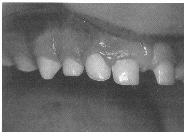
Slika 2. Prekobrojni gornji desni lateralni sjekutić Figure 2. A supernumerary maxillary right lateral incisor

Hiperdoncija mliječnih zuba nađena je samo u dječaka, a uvijek su bili zahvaćeni samo gornji lateralni sjekutići (slika 2). Analiza dvostrukih zuba u mliječnoj denticiji provedena je u prijašnjem članku (10).