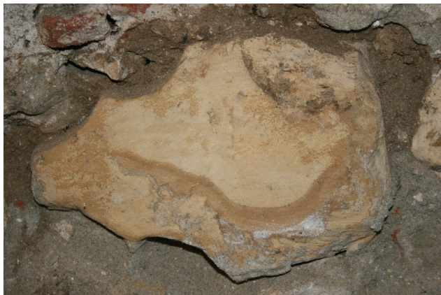
Slika 3. Varaždin, kripta župne crkve sv. Nikole, rebro gotičkog svoda

nima i nizu drugih sakralnih građevina u kontinentalnoj Hrvatskoj. Obzirom da se u varaždinskim gradskim zapisnicima s kraja 15. stoljeća navodi da se stara crkva sv. Nikole pregrađuje i proširuje, to nam također potvrđuje dataciju svodnih rebara i gotičku fazu gradnje crkve u kraj 15. stoljeća. U posljednja dva desetljeća 15. stoljeća datira se i gradnja crkve sv. Marije u Remetincu kod Novog Marofa, čiji se oblik svodnih rebara poklapa sa varaždinskim. Tako se ostaci rebara u kripti župne crkve sv. Nikole može okarakterizirati kao tipično kasnogotičke elemente. Daljnjim pregledom kripte župne crkve, jedan od spolija ugrađenih u zapadni zid kripte posebno nas je privukao svojim oblikovanjem. Pažljivim pregledom dostupnog dijela ovog spolija, utvrđeno je kako je moguće da se radi o ključnom kamenu. Ključni kamen je mjesto gdje se sastaju rebra u najvišoj točki svođenja. On u ranoj gotici ima važno mjesto u konstrukcijskom sustavu, dok je u kasnijim gotičkim građevinama više dekorativnog i simboličkog značenja budući da se mnoga rebra sabiru u snopu ili se križaju bez ključnog kamena. Ključni kamen zato ima posebno simbolično značenje najvažnijeg elementa arhitektonske plastike, te često ima uklesane ili aplicirane različite dekorativno – simbolične ukrase.