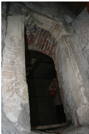
Slika 5. Varaždin, toranj župne crkve sv. Nikole, kameni portal

ostaci gotičke faze tornja, a u donjim zonama i kriпти i romanička faza izgradnje. Tako se na trećoj etaži iznutra naziru ostaci gotičkih šiljasto zaključenih prozora koje Dijana Vukičević – Samaržija uspoređuje sa klaustarskim prozorima u Remetincu, 14 što je, uz svodna rebra, koja su ranije u tekstu povezana sa remeti-nečkom crkvom, još jedna poveznica ovih dviju građevina. U gornje etaže tornja danas se dolazi spiralnim stubištem, dograđenim uz istočno pročelje tornja, dok je nekadašnja komunikacija išla vertikalno kroz toranj. Prolaz iz spiralnog stubišta prema tornju izveden je kroz kameni gotički portal, oblikovan „na rame“ (Sl. 5). Ova vrata su spolij, izmaknut s izvorne pozicije, koja je za sada nepoznata. Gornji uglovi okvira ukrašeni su zanatski dobro izvedenim trokutastim ukrasi-ma koji potvrđuju prisustvo dobrih klesara. Moguće je da ovaj portal potječe sa jednog od tri ulaza u gotičku crkvu koje spominju vizitacije. Na bočnim stranama portala nalaze se urezi, vjerojatno nastali prije ugradnje vratiju na ulaz u toranj. Radi se o urezima koji prikazuju skicu grba sa križem i ljudske likove (jednog sa rogovima), te mnoštvo rupica (Sl. 6). Ovi urezi mogli bi biti votivnog karaktera. 15