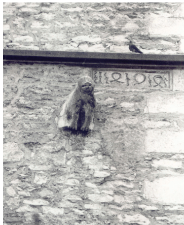
Slika 7. Varaždin, toranj župne crkve sv. Nikole, pročelje prije obnove (fotodokumentacija Konzervatorskog odjela Varaždin)

Posebno zanimljiv primjer očuvane starije kamene plastike u gradu Varaždinu skulptura je medvjeda, koja se nalazila ugrađena u zvonik crkve sv. Nikole (Sl. 7), a tijekom radova na obnovi 1992. godine, izvađena je (Sl. 8), i pohranjena u lapidariju Gradskog muzeja Varaždin, dok je na isto mjesto u zvonik ugrađena replika skulpture.