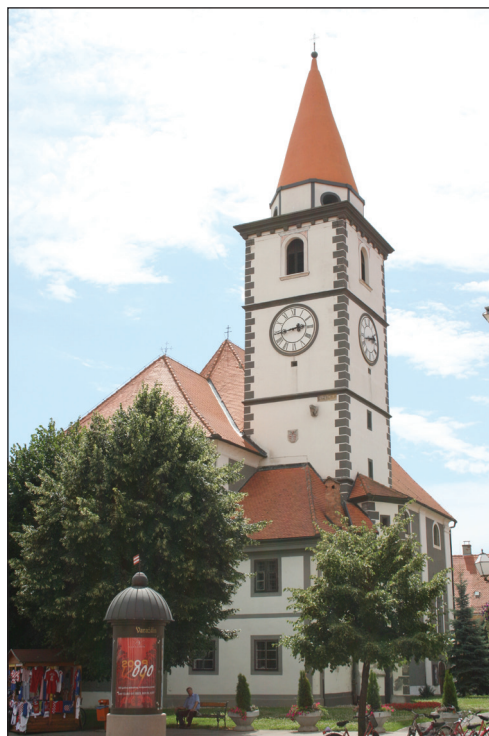
Slika 1. Varaždin, župna crkva sv. Nikole

Crkva sv. Nikole smještena je u centru Varaždina, u blizini južnog ulaza u povijesnu gradsku jezgru (Sl. 1).