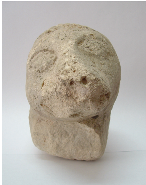
Slika 11. Skulptura životinje, Muzej Sveti Ivan Zelina, (foto: Vjekoslav Jukić)

Uspoređujući varaždinskog medvjeda sa komparativnim materijalom, primjerice, s životinjskom glavicom iz Zeline (Sl. 11), koja je datirana na početak 13. stoljeća; mogu se pronaći sličnosti u bademastom obliku i obradi očiju, u obradi dlake – koja je također stilizirana valovitim užljebljenjima, te u samoj formi glave. Sličnost u obradi tijela valovitim užljebljenjima vidljiva je i na prikazu lavova na kapitelima ruševina crkve u Vértesszentkeresztu, koji su datirani između 1200. i 1237. godine. Identično oblikovane oči kao kod varaždinskog medvjeda, mogu se vidjeti na muškoj glavi iz Zalavára (1200-1240). 16