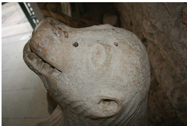
Slika 10. Varaždin, lapidarij Gradskog muzeja Varaždin, skulptura medvjeda