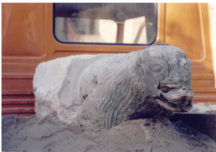
Slika 8. Skulptura medvjeda nakon skidanja s tornja, (fotodokumentacija Konzervatorskog odjela Varaždin)