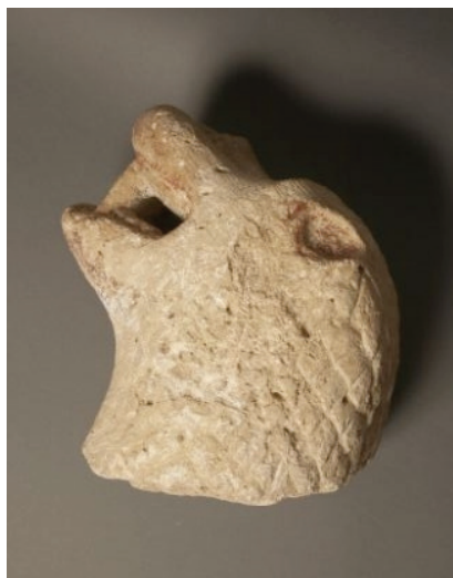
Slika 12. Skulptura životinje, Balassa Bálint Museum u Esztergomu, Mađarska, inv. br. 68.3.1

U ranijem radu autorica ovog teksta 17 varaždinski je medvjed uspoređen sa glavom lava iz Bajne (Sl. 12), koji je datiran u 12. stoljeće; velika sličnost vidljiva je u obliku glave te u oblikovanju njuške, poluotvorenih usta i ušiju. Također je zanimljiva i usporedba s prikazom medvjeda na kamenom ulomku s reljefnim prikazom medvjeda iz lokaliteta Cage kod Okučana, 18 koji ukazuje na važnost medvjeda za srednjevjekovnog čovjeka; određena sličnost prisutna je u prikazu šapa te u naglašenosti usta i zubi.