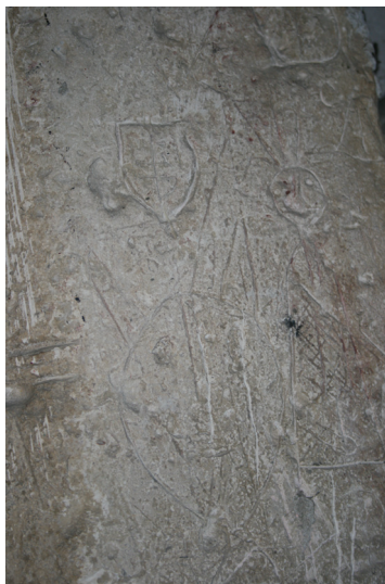
Slika 6. Varaždin, toranj župne crkve sv. Nikole, urezi na portalu