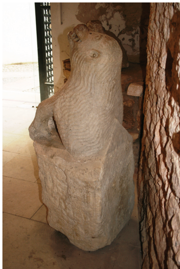
Slika 9. Varaždin, lapidarij Gradskog muzeja Varaždin, skulptura medvjeda

Promatrajući skulpturu medvjeda (Sl. 9 i 10), prvo što uočavamo jest veza- nost same skulpture uz kameni blok, tj. medvjed prednjim djelom kao da „izlazi“ iz kamenog bloka, koji je pažljivo obrađen, te s gornje strane završava trokutasto u smjeru skulpture. Na zaglađenom dijelu kamenog bloka nalaze se klesarske oznake te tragovi spajanja, što upućuje da je medvjed prvotno bio samo dio veće cjeline. Skulptura medvjeda izrađena je od sivog pješčenjaka, a kako je stoljeći-