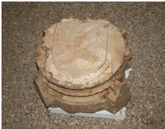
Slika 4. Varaždin, kripta župne crkve sv. Nikole, ključni kamen

Dimenzije štita su 27.5 cm x 22 cm, sa 1 cm visine. U sredini štita nalazi se djelomično otučena i oštećena ptica, sa desne strane uklesana je sedmerokraka zvijezda, a s lijeve slovo N. Ptici su dobro očuvane samo noge, sa jasno uklesanim plivačim kožicama te bogat i kratak rep. Ostali dijelovi vidljivi su samo kao obris. Zvijezda i inicijal očuvani su u cijelosti. Zvijezde, inicijal i neoštećeni dijelovi ptice pokazuju da je riječ o vještom klesaru, koji je elemente skladno uklopio na oblik štita, a veličinu i smještaj štita prilagodio kružnom presjeku ključnog kamena. Povijesni dokumenti i iščitavanje profilacije na ključnom kamenu i svodnim rebrima smještaju nastanak svoda u drugu polovicu, ili sam kraj 15. stoljeća. Na širem varaždinskom području postoje očuvani svodovi, svodna rebra i ključni kamenovi građevina nastalih u tom razdoblju, kao što je na primjer sv. Marija u Remetincu. Dok se profilacija svodnih rebara podudara, ključni kamenovi izvedeni su na različit način, budući da su u Remetincu grbovi naknadno aplicirani, dok su u Varaždinu integrirani dio ključnog kamena. Pregledom očuvanih ključnih kamenova na širem području pronađena je sličnost u pristupu obradi donje plohe samo na ključnom kamenu crkve u Loboru, gdje se također nalazi vrlo sličan uklesani grb, međutim, loborska gotička faza crkve nastala je znatno ranije od varaždinske.