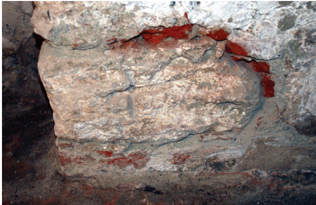
Slika 2. Varaždin, kript a župne crkve sv. Nikole, kameni blok s križem

Manji dio spolija izrađen je od sivog pješčenjaka, koji je jednak kamenu od kojeg je izrađena skulptura medvjeda, ugrađena na pročelju. Radi se o velikim klesanim kamenim blokovima, koji su uglavnom oštećeni i bez oznaka. Međutim, jedan od klesanaca ima na sebi uklesani križ (Sl. 2). Dimenzije tog kamena su cca 55 x 32 cm, sa većim oštećenjima na jednoj strani. Budući da su ovi kameni blokovi od iste vrste kamena kao i životinjska skulptura sa zvonika, može se zaključiti da su iz istog razdoblja, odnosno iz romaničke faze crkve 12. i početka 13. stoljeća.