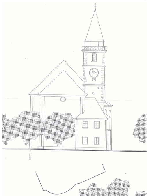
Slika 13. Sv. Nikola, Varaždin, gotički toranj 22