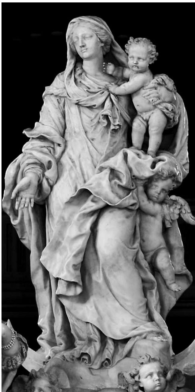
2. Giusto Le Court, Bogorodica s Djetetom , Santa Maria della Salute, Venecija

Giusto Le Court, The Virgin with the Child, Santa Maria della Salute, Venice