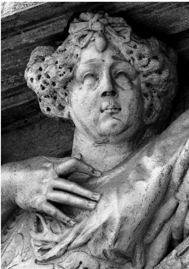
6. Giovanni Bonazza, Sibila , Santa Maria del Giglio, Venecija, detalj Giovanni Bonazza, Sybil , Santa Maria del Giglio, Venice, a detail