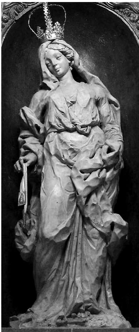
4. Giovanni Bonazza, Gospa Karmelska , Sant'Agnese, Treviso Giovanni Bonazza, Our Lady of Carmel, Sant'Agnese, Treviso