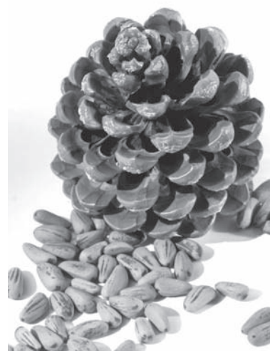
Slika 2. Češer i sjeme pinije Figure 2 Cone and stone pine seeds