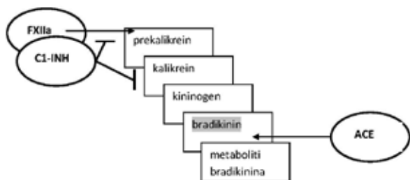
Sl. 1. Stvaranje bradikinina u kininsko-kalikeinskom sustavu

Otpuštanje bradikinina je fiziološki regulirano s više inhibitora. C1 inhibitor je najvažniji fiziološki inhibitor plazmatskog kalikreina, faktora XIa, faktora XIIa, proteaza u fibrinolizi i proteina komplemnog puta, što ga čini regulatorom tih međusobno povezanih proinflamacijskih putova (sl. 2). Deficitom C1- INH, kalikreinu iz plazme je „dozvoljeno“ da se aktivira što vodi produkciji bradikinina. Drugi važan inhibitor medijatora krvi je ACE (Angiotensin Converting Enzyme), aktivator angiotenzina. Inhibicija njegove aktivnosti, npr. u terapiji hipertenzije, dovodi do smanjene konverzije angiotenzina I u vazokonstriktorni angiotenzin II. Paralelno s učinkom na RAAS (Renin-Angiotenzin-Aldosteron Sustav) očituje se učinak na smanjenje degradacije bradikinina. Veće koncentracije bradikinina u nekih osoba dovode do simptoma suhog kašlja, dok se u drugih javljaju bradikininiski angioedemi, potencijalno opasni, lokalizirani otoci regije glave i vrata. Prema nekim autorima povoljan učinak ACE inhibitora na arterijsku hipertenziju, ventrikularni remodeling nakon infarkta miokarda i dijabetičku nefropatiju posljedica su njihovog učinka na kininsko-kalikeinski sustav. Kada je zbog djelovanja ACEi povećana razina bradikinina u krvi, uključuju se paralelni metabolički putovi koji tu razinu pomalo smanjuju. Jedan od enzima u tim putevima je aminopeptidaza P. Osobe koje