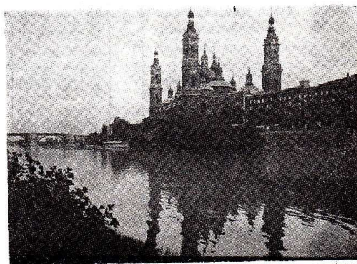
Slika 2. Crkva Nuestra Señora del Pilar