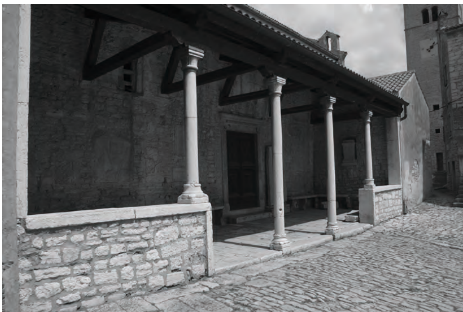
Sl. 1 – a. Crkva sv. Martina u Svetom Lovreču, začelje; b. Crkva sv. Martina u Svetom Lovreču, južno pročelje s gradskom ložom