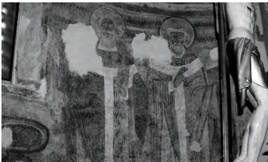
Sl. 3 – a, b. Crkva sv. Martina u Svetom Lovreču, zidne slike u južnoj apsidi