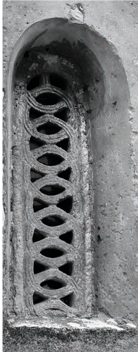
Sl. 4 – a, b. Crkva sv. Martina u Svetom Lovreču, prozorske tranzene na južnom zidu crkve (a,b) i južnoj apsidi (c)